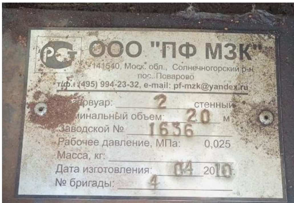
Рисунок 1 – Маркировочная табличка резервуара