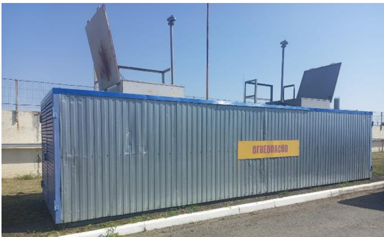
Рисунок 2 – Общий вид резервуара РГ 20/2-П-02-УХЛ1ТУ