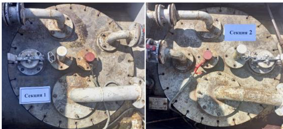
Рисунок 4 – Горловины и измерительные люки резервуара РГ 20/2-П-02-УХЛ1ТУ зав.№ 1636 Пломбирование резервуара РГ 20/2-П-02-УХЛ1ТУ не предусмотрено.