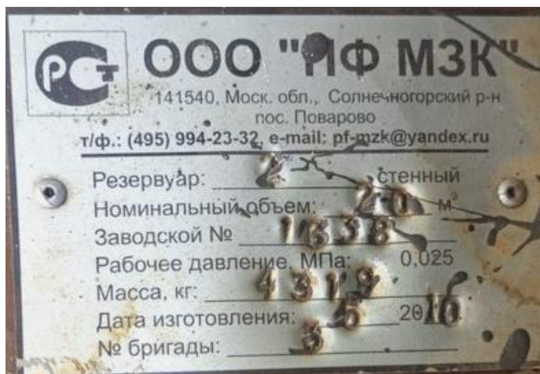
Рисунок 1 – Маркировочная табличка резервуара