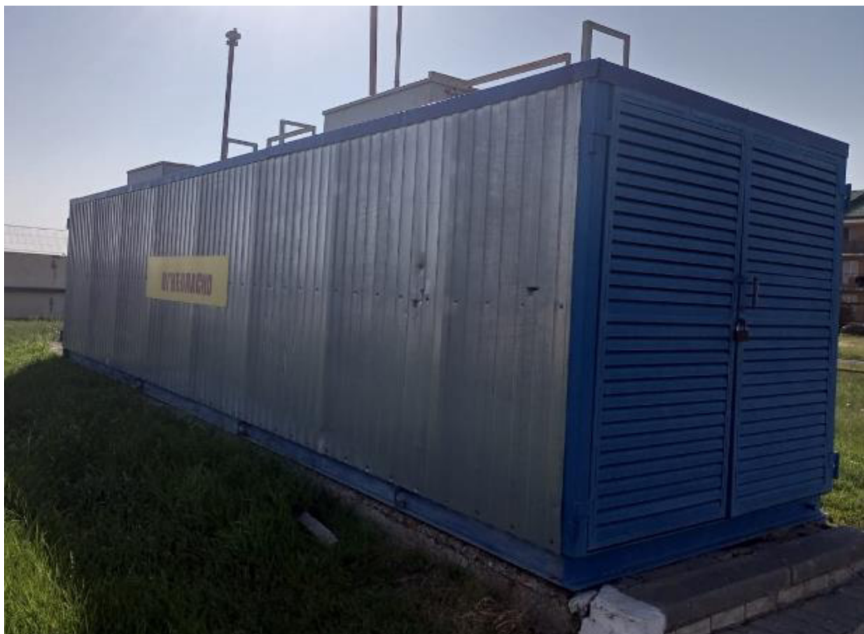
Рисунок 2 – Общий вид резервуара РГ 20/2-П-02-УХЛ1ТУ