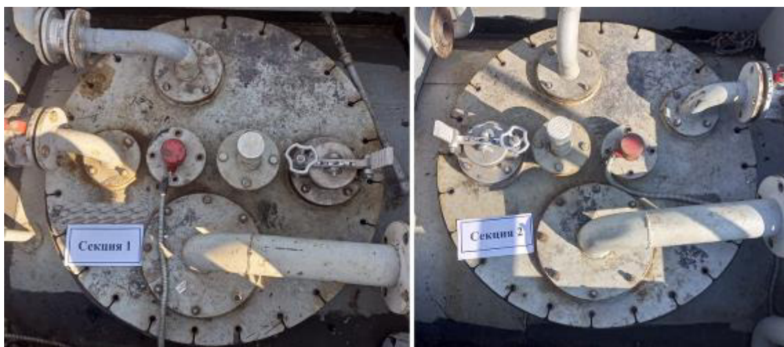
Рисунок 4 – Горловины и измерительные люки резервуара РГ 20/2-П-02-УХЛ1ТУ зав.№ 1638 Пломбирование резервуара РГ 20/2-П-02-УХЛ1ТУ не предусмотрено.