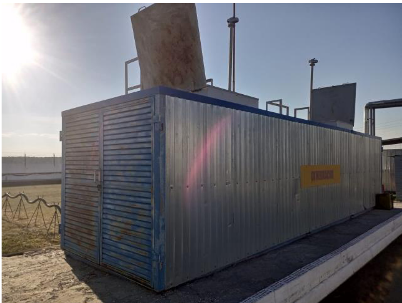
Рисунок 2 – Общий вид резервуара РГ 20/2-П-02-УХЛ1ТУ