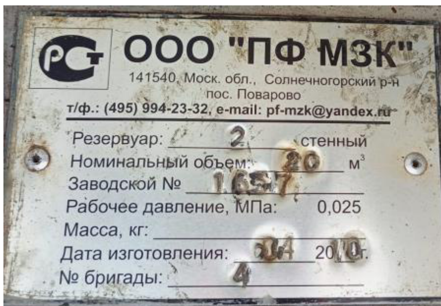
Рисунок 1 – Маркировочная табличка резервуара