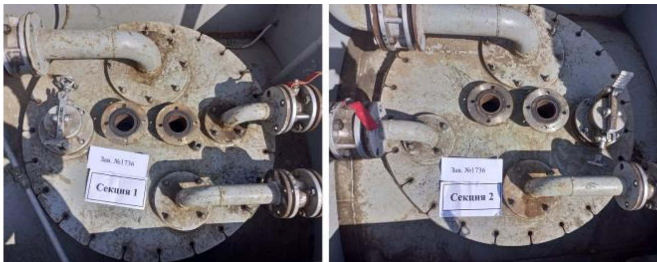
Рисунок 3 – Горловины и измерительные люки резервуара РГ 20/2-П-02-УХЛ1ТУ зав.№ 1736

Пломбирование резервуара РГ 20/2-П-02-УХЛ1ТУ не предусмотрено.