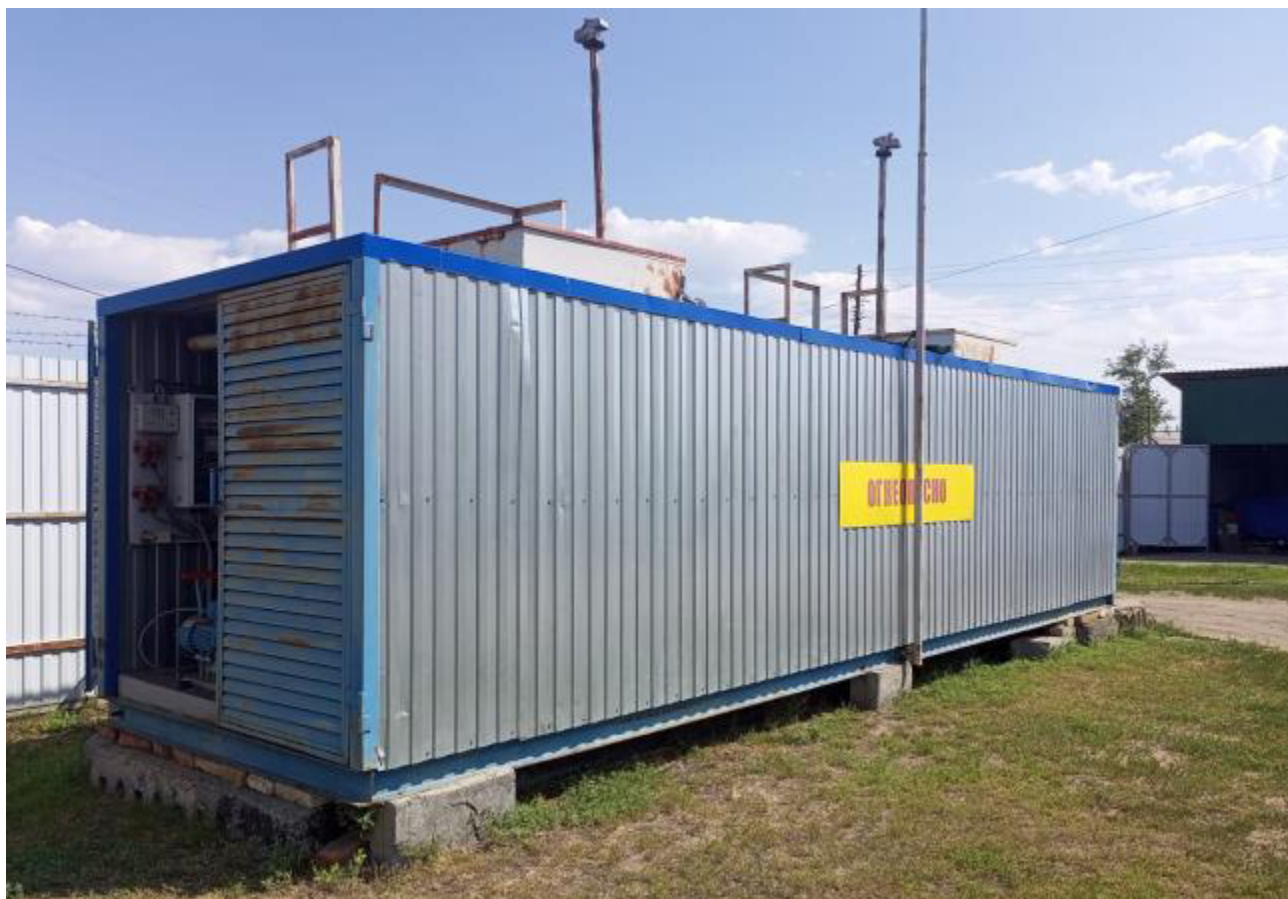
Рисунок 1 – Общий вид резервуара РГ 20/2-П-02-УХЛ1ТУ