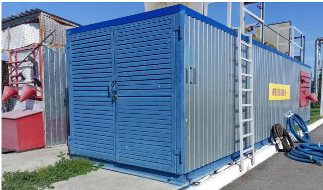
Рисунок 2 – Общий вид резервуара РГ 20/2-П-02-УХЛ1ТУ