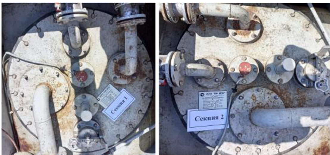
Рисунок 4 – Горловины и измерительные люки резервуара РГ 20/2-П-02-УХЛ1ТУ зав.№ 1798 Пломбирование резервуара РГ 20/2-П-02-УХЛ1ТУ не предусмотрено.