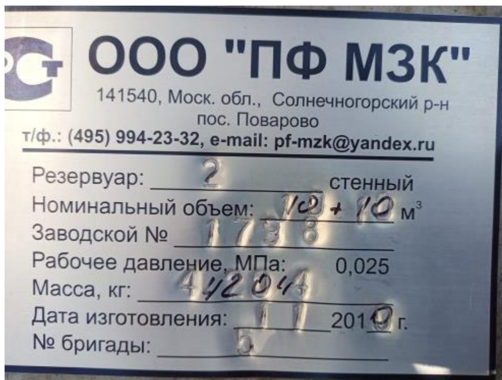
Рисунок 1 – Маркировочная табличка резервуара