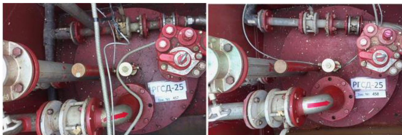
Рисунок 3 – Горловины и измерительные люки резервуаров РГСД-25 зав.№№ 457, 458