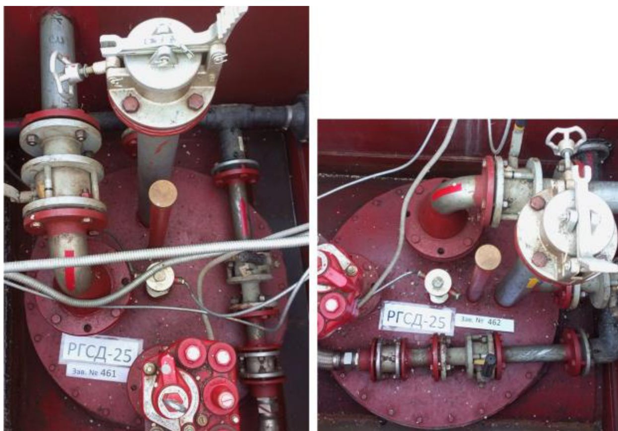
Рисунок 5 – Горловины и измерительные люки резервуаров РГСД-25 зав.№№ 461, 462 Пломбирование резервуаров РГСД-25 не предусмотрено.