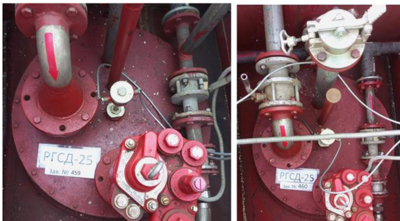
Рисунок 4 – Горловины и измерительные люки резервуаров РГСД-25 зав.№№ 459, 460