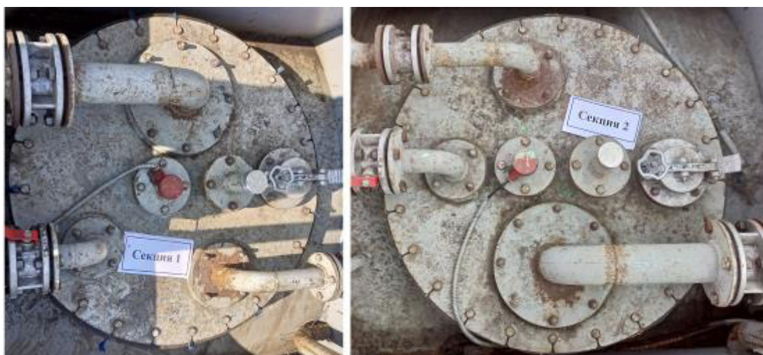
Рисунок 4 – Горловины и измерительные люки резервуара РГ 20/2-П-02-УХЛ1ТУ зав.№ 1858 Пломбирование резервуара РГ 20/2-П-02-УХЛ1ТУ не предусмотрено.