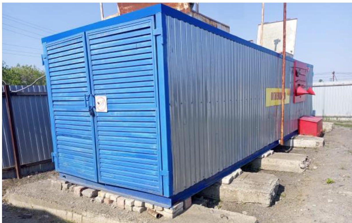
Рисунок 2 – Общий вид резервуара РГ 20/2-П-02-УХЛ1ТУ