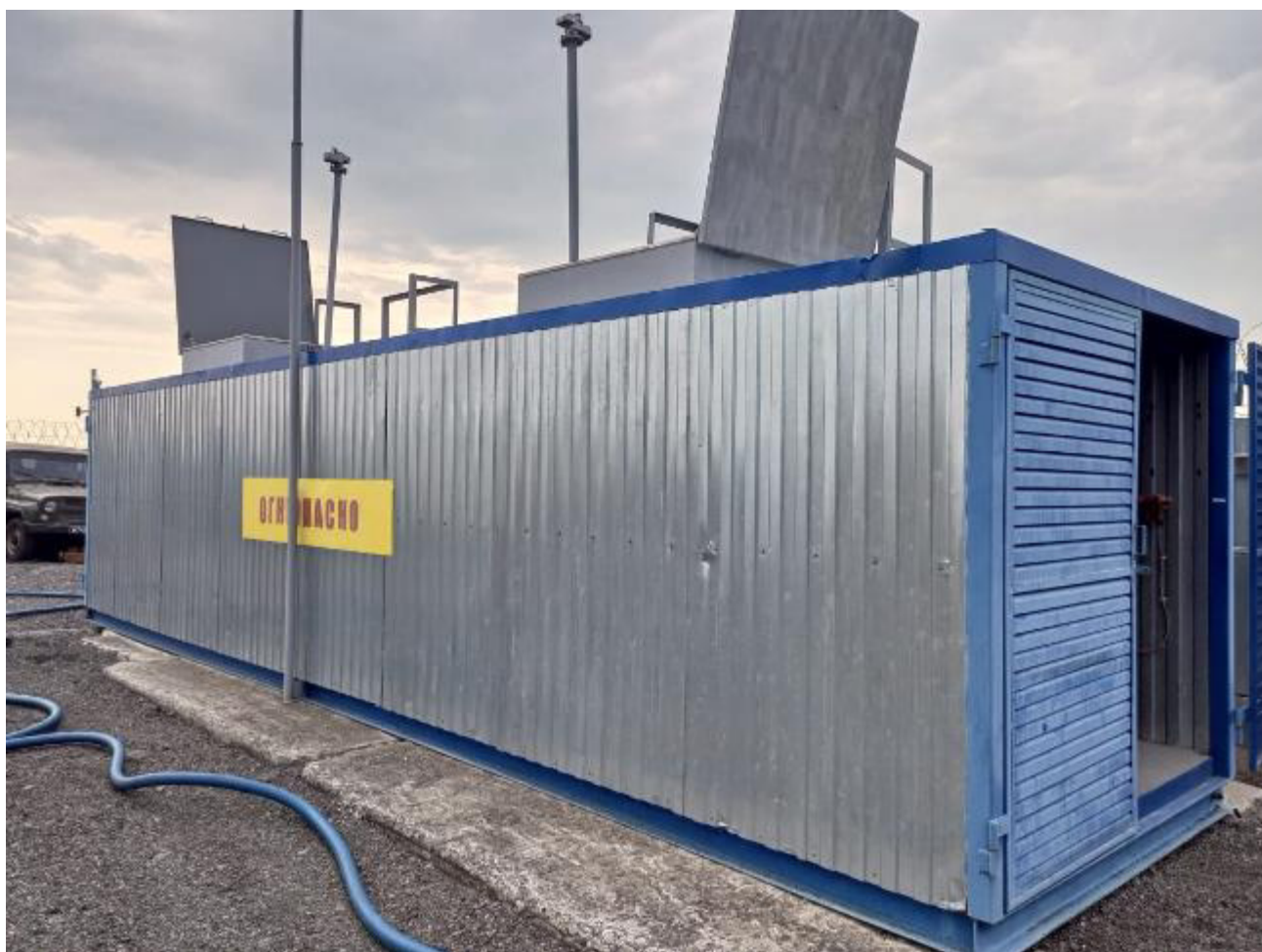
Рисунок 2 – Общий вид резервуара РГ 20/2-II-02-УХЛ1ТУ