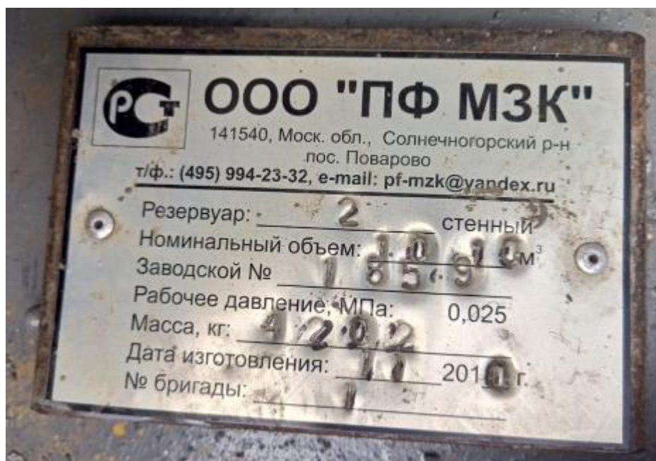
Рисунок 1 – Маркировочная табличка резервуара