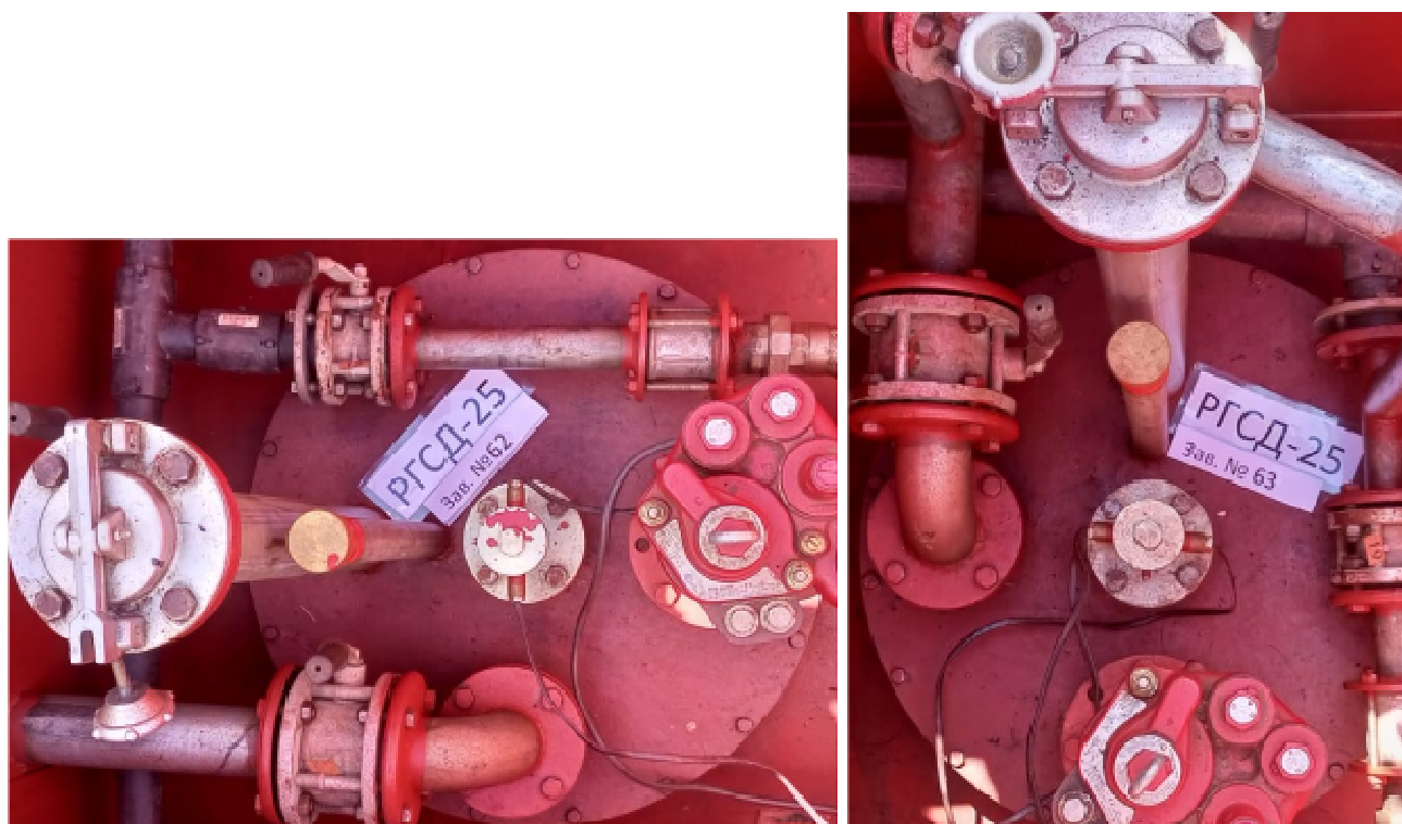
Рисунок 5 – Горловины и измерительные люки резервуаров РГСД-25 зав.№№ 62, 63 Пломбирование резервуаров РГСД-25 не предусмотрено.