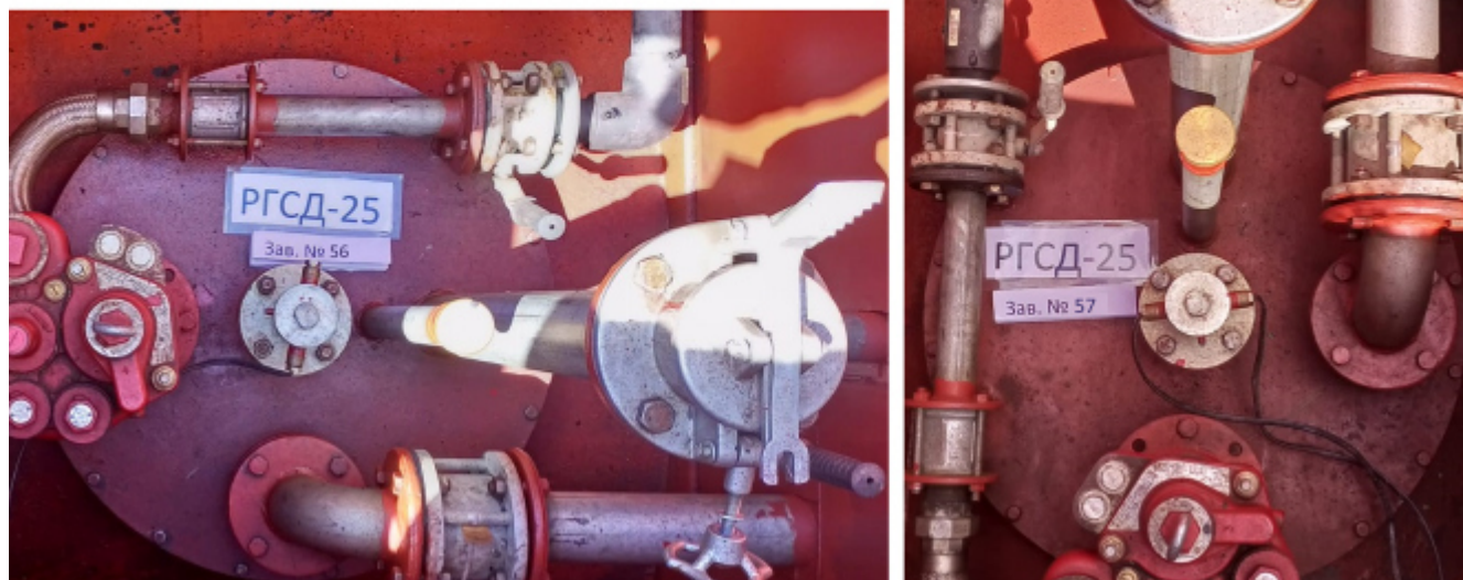
Рисунок 2 – Горловины и измерительные люки резервуаров РГСД-25 зав.№№ 56, 57