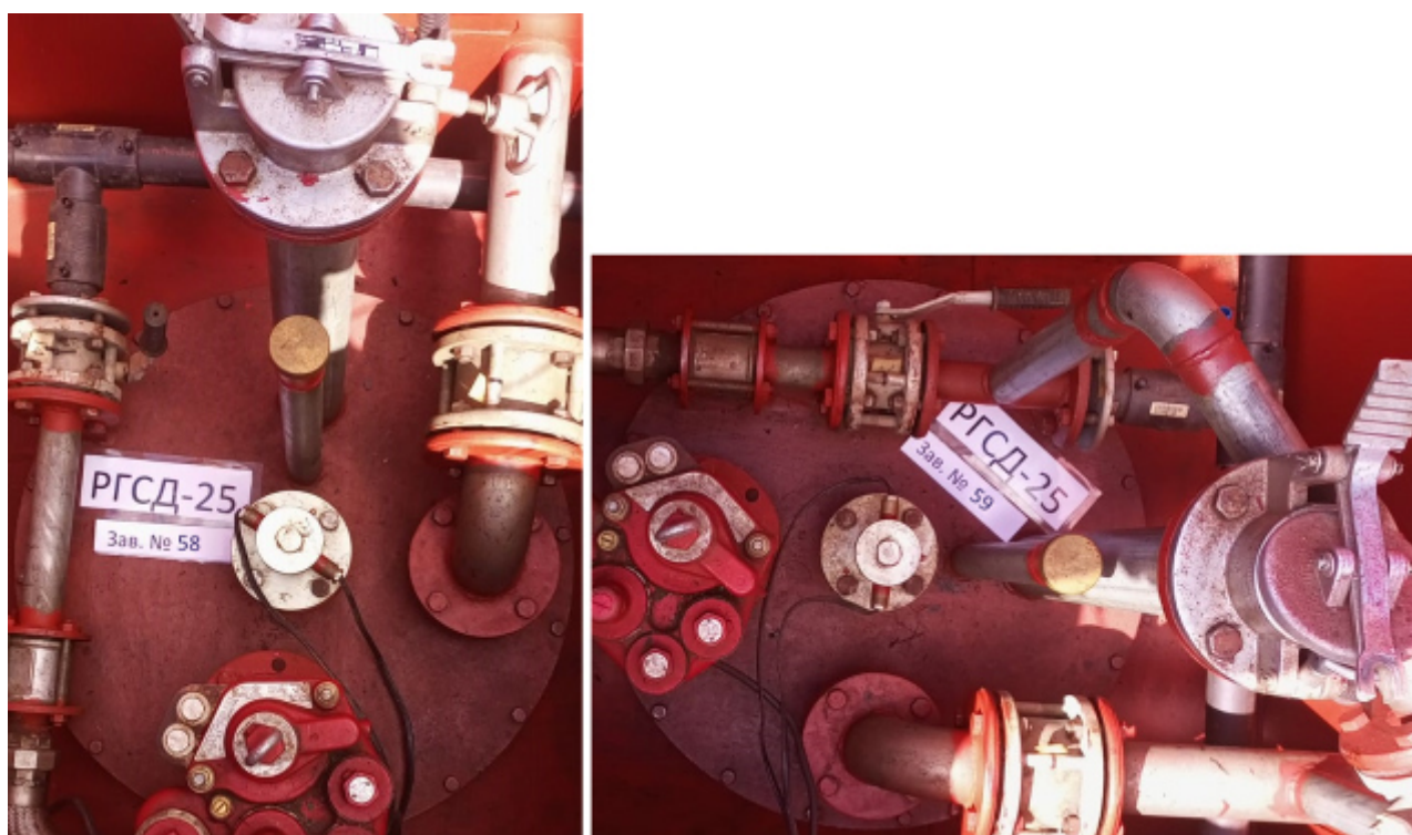
Рисунок 3 – Горловины и измерительные люки резервуаров РГСД-25 зав.№№ 58, 59