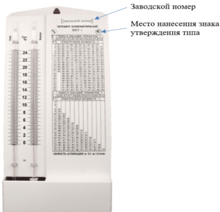
Рисунок 1 – Общий вид гигрометров психрометрических исполнения ВИТ-1