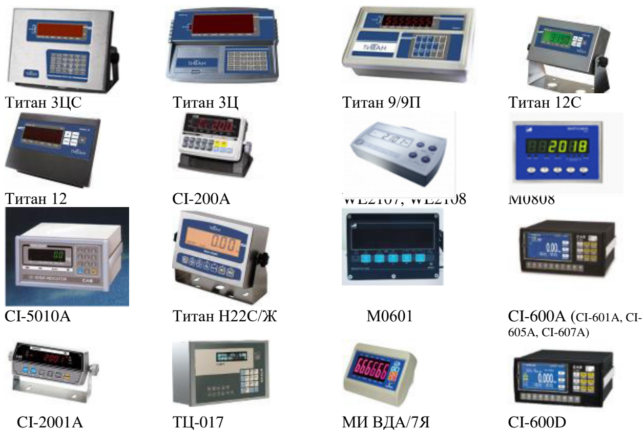
Рисунок 3 – Общий вид индикаторов