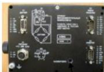
МИКРОСИМ M0601, M0808