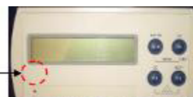
Место нанесения разрушаемых наклеек Пломбировка доступа к переключателю режимов настройки и юстировки на передней панели корпуса приборов модификаций WE2107, WE2108