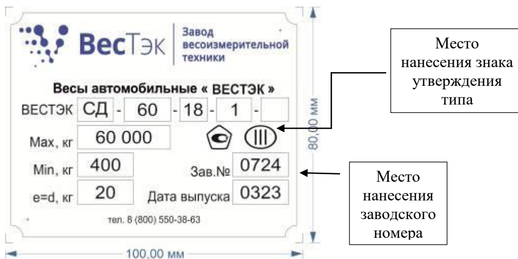
Рисунок 1 – Пример маркировочной таблички с указанием места нанесения знака утверждения типа, заводского номера

Заводской номер в цифровом формате и знак утверждения типа наносятся на металлическую маркировочную табличку методом гравировки.