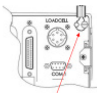
СІ-600А (СІ-601А, СІ-605А, СІ-607А), 600D