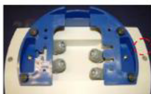
Пломбировка крепежного винта на задней панели корпуса приборов модификаций WE2107, WE2108