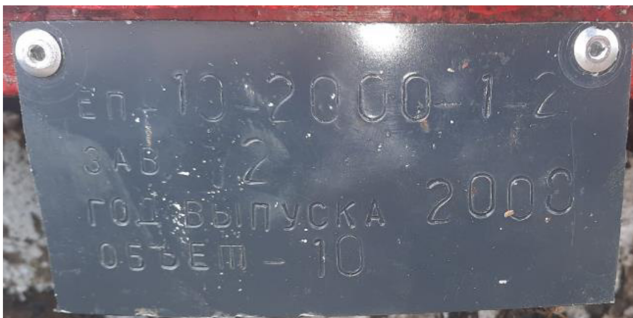
Рисунок 1 – Маркировочная табличка