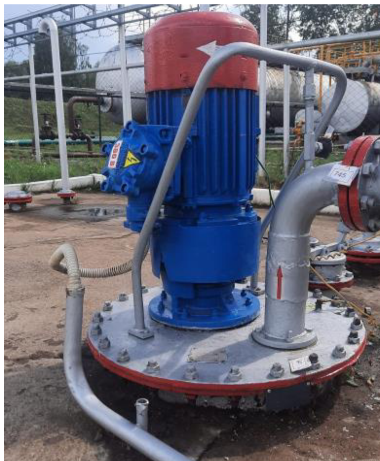
Рисунок 2 – Горловина и измерительный люк резервуара ЕП-10-2000-1-2