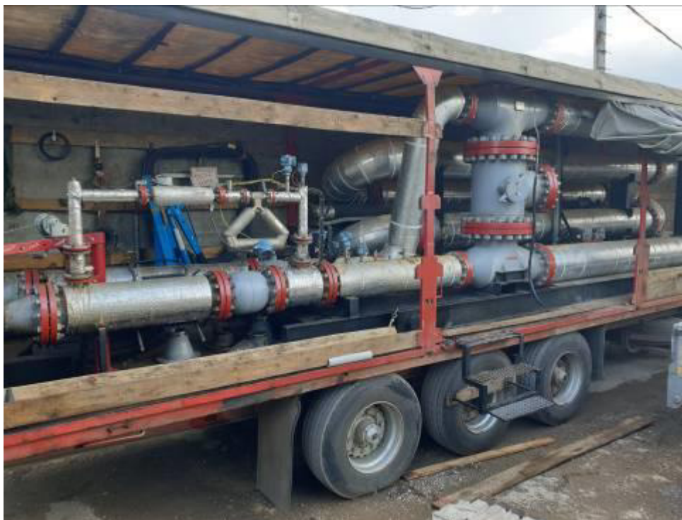
Рисунок 1 – Общий вид ТПУ

Пломбировка ТПУ осуществляется нанесением знака поверки давлением на свинцовые (пластмассовые) пломбы, установленные на контрольных проволоках, пропущенных через отверстия в шпильках, расположенных на диаметрально противоположных фланцах, по всей длине цилиндрического калиброванного участка и на контрольных проволоках, пропущенных через отверстия завернутых винтов клеммной коробки детекторов.