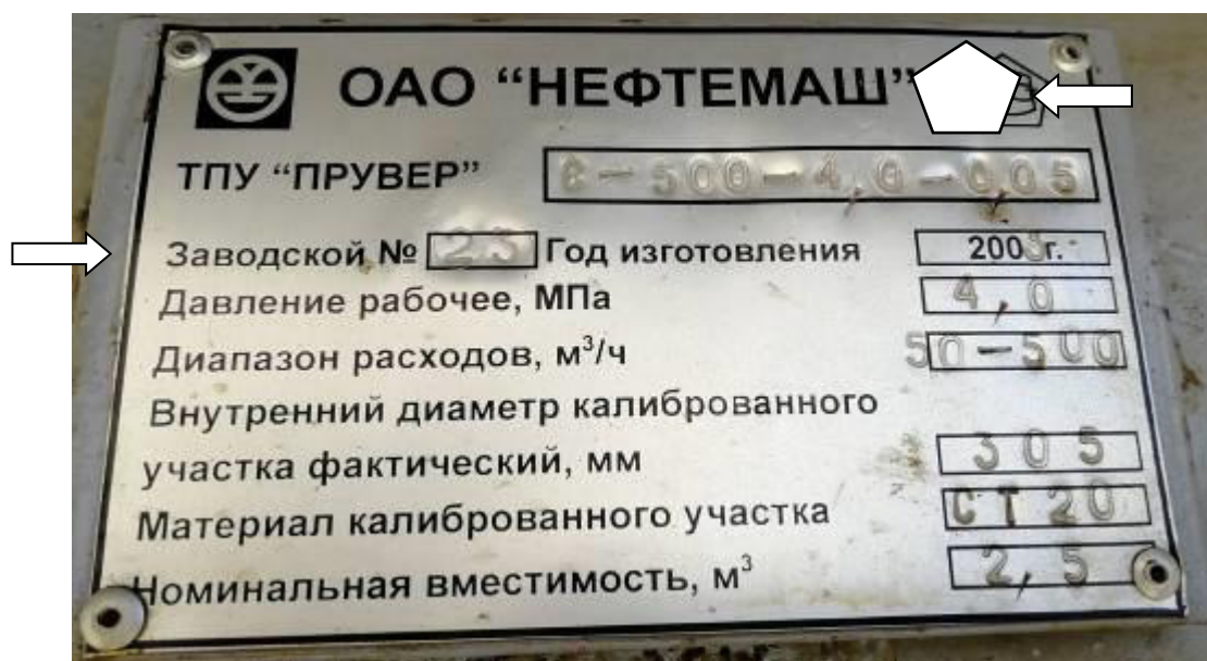
Рисунок 3 – Обозначения мест нанесения знака утверждения типа и заводского номера