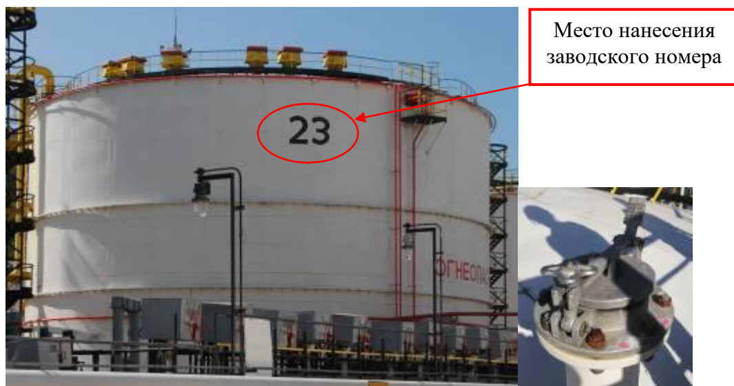
Рисунок 2 – Общий вид резервуара и замерного люка РВС-10000 зав.№ 23