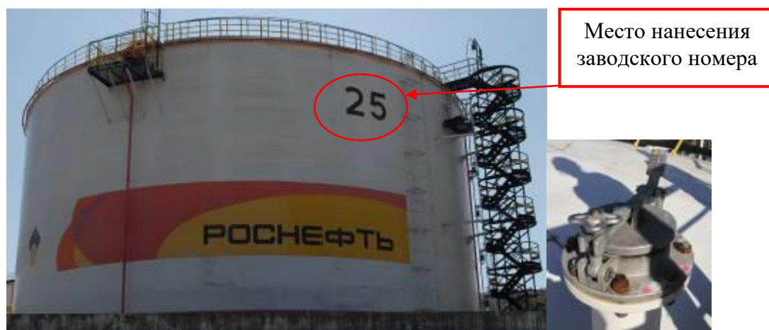
Рисунок 3 – Общий вид резервуара и замерного люка РВС-10000 зав.№ 25