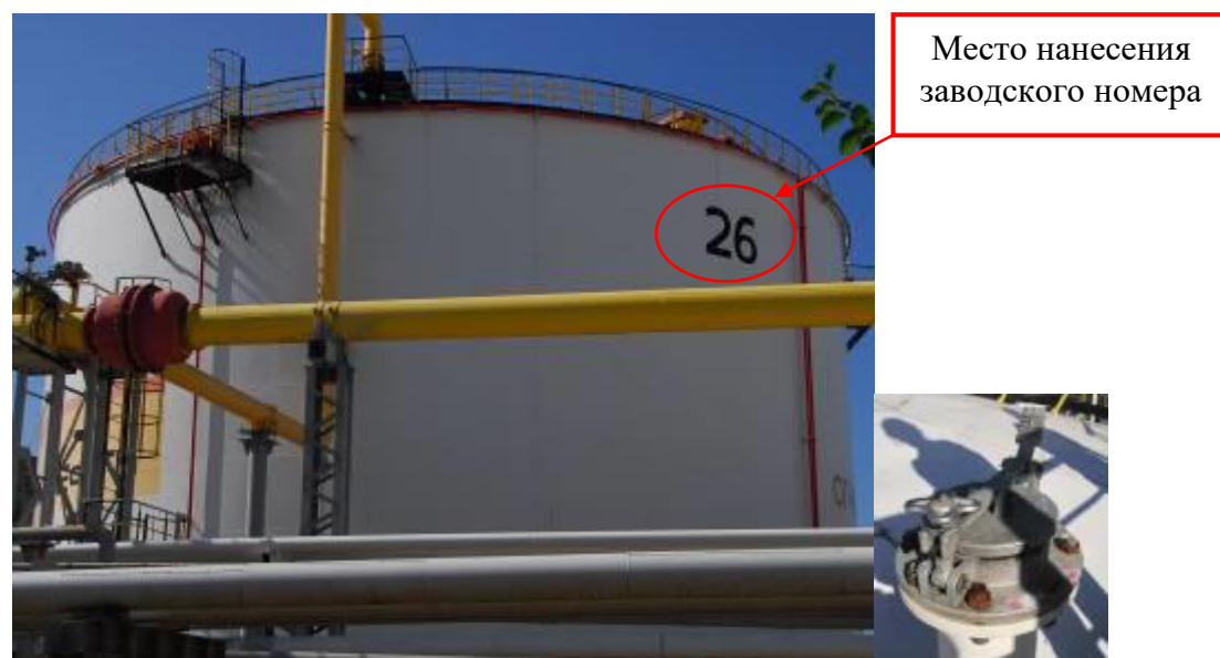
Рисунок 4 – Общий вид резервуара и замерного люка РВС-10000 зав.№ 26