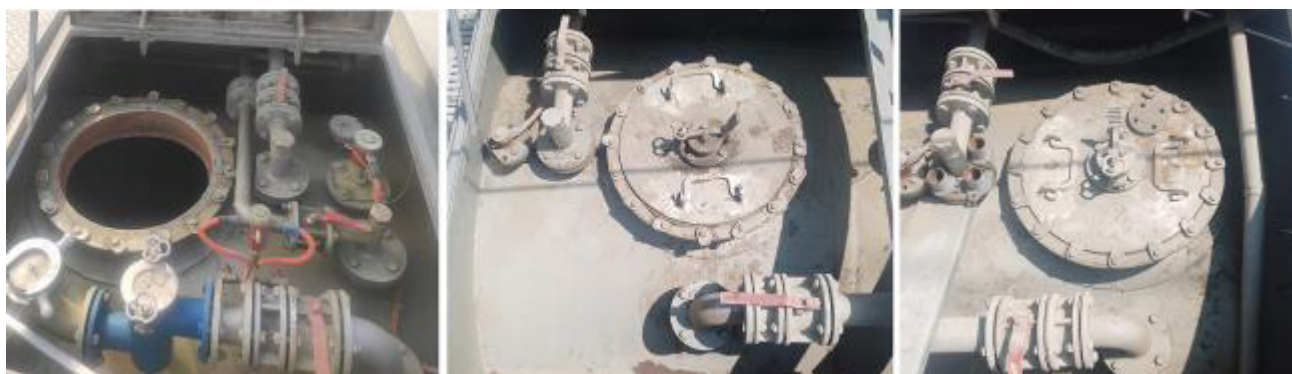
Рисунок 3 – Горловины и измерительные люки резервуара РГ20(5/5/10) зав.№ 3075

Пломбирование резервуара РГ20(5/5/10) не предусмотрено.