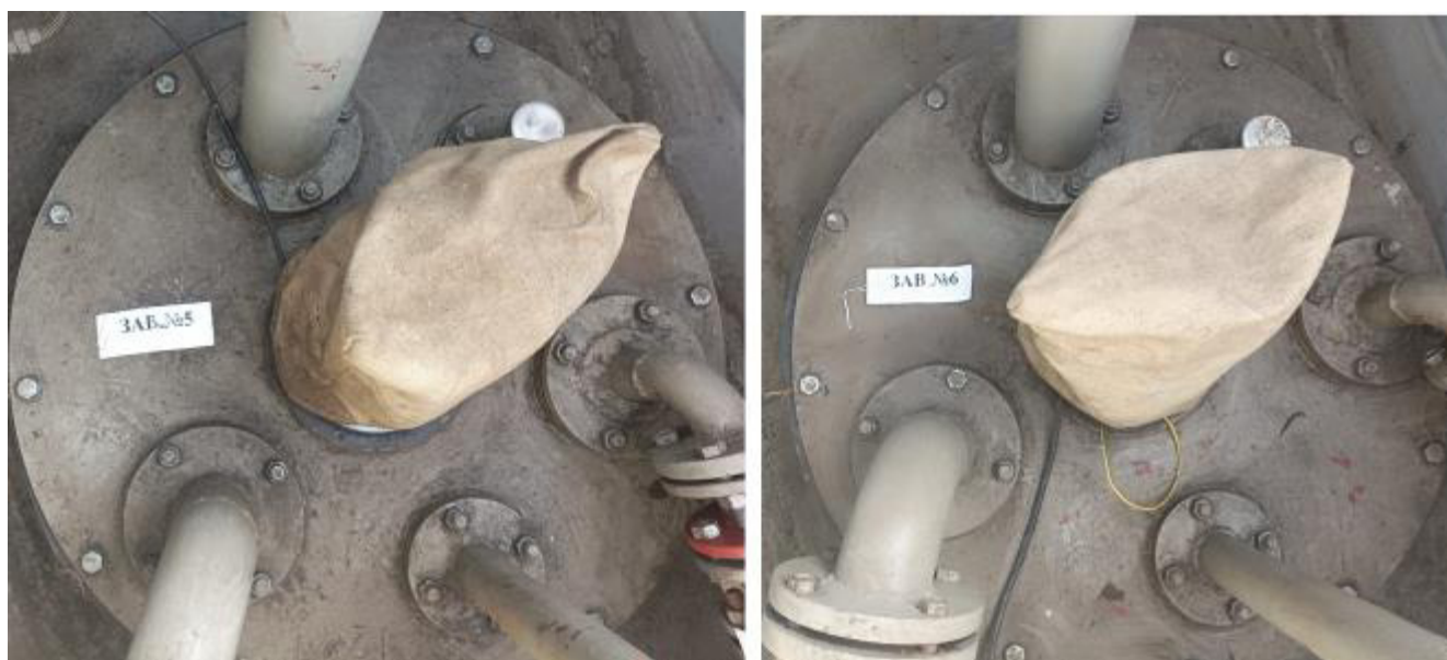
Рисунок 4 – Горловины резервуаров РГС-25 зав.№№ 5, 6

Пломбирование резервуаров РГС-25 не предусмотрено.