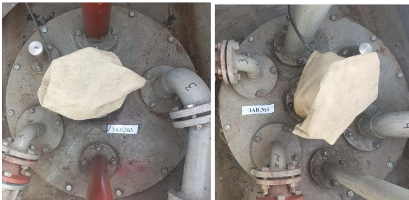
Рисунок 3 – Горловины резервуаров РГС-25 зав.№№ 3, 4