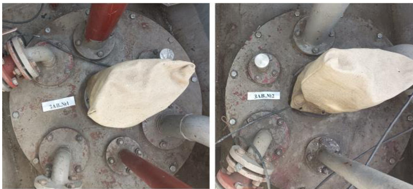
Рисунок 2 – Горловины резервуаров РГС-25 зав.№№ 1, 2