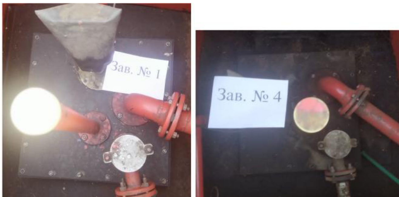
Рисунок 3 – Горловины резервуаров РГС-30 зав.№№1, 4

Пломбирование резервуаров РГС не предусмотрено.