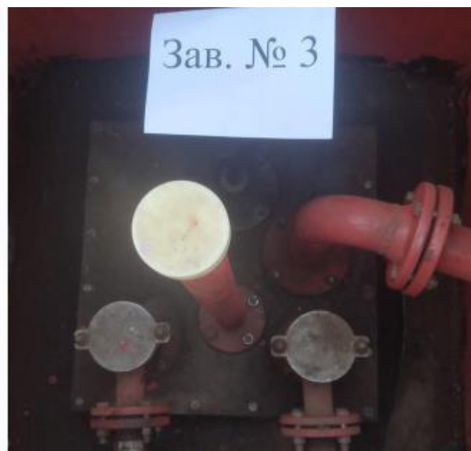
Рисунок 2 – Горловины резервуаров РГС-25 зав.№№2, 3