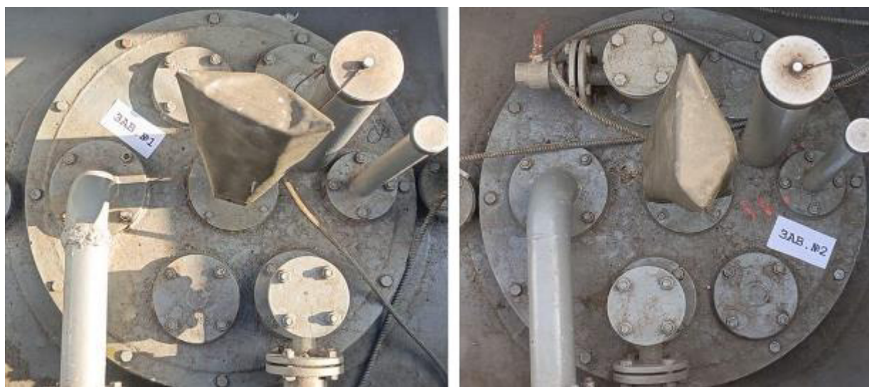
Рисунок 2 – Горловины резервуаров РГС-25 зав.№№ 1, 2