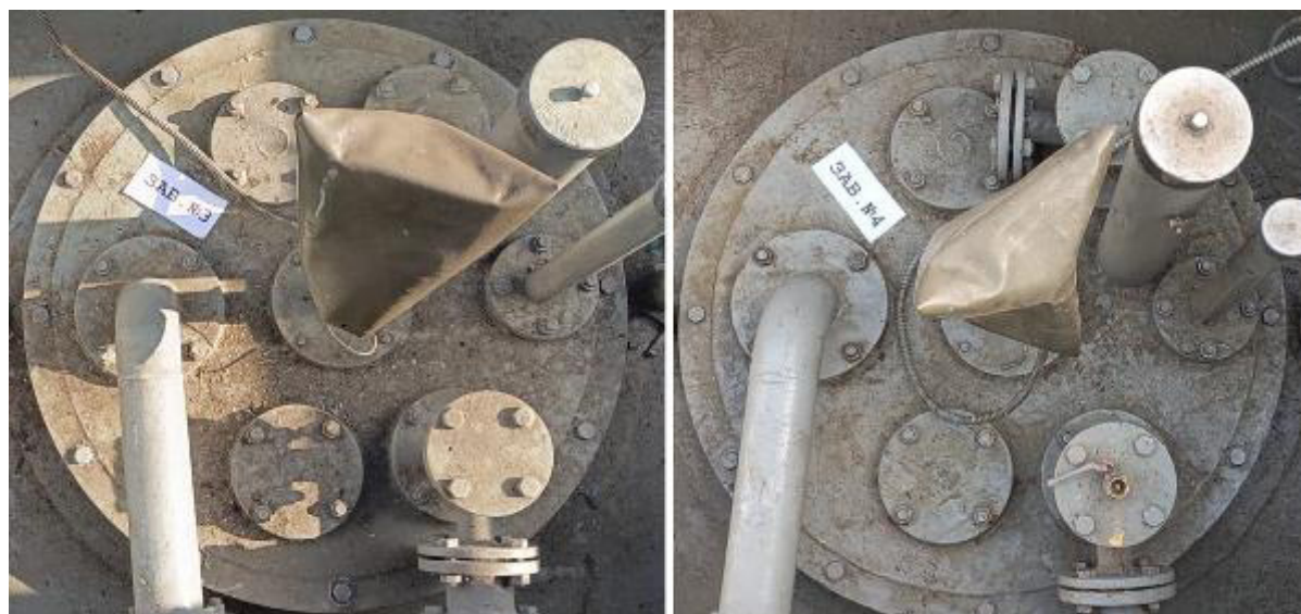
Рисунок 3 – Горловины резервуаров РГС-25 зав.№№ 3, 4

Пломбирование резервуаров РГС-25 не предусмотрено.