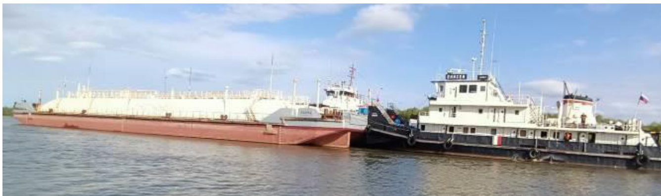
Р и с у н о к 1 – Общий вид нефтеналивной баржи «Пойма-4»

Общий вид нефтеналивной баржи «Пойма-4» представлен на рисунке 1. Схематичное расположение танков на палубе нефтеналивной баржи «Пойма-4» представлено на рисунке 2.