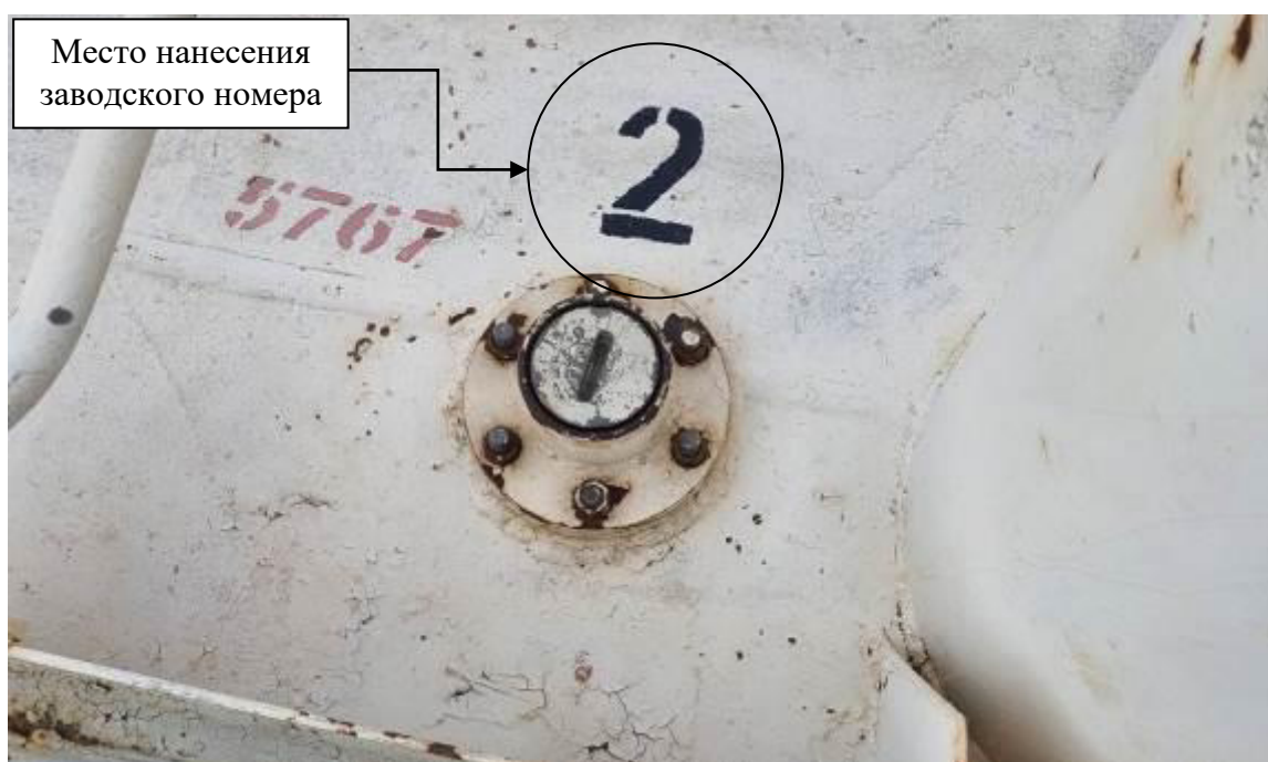
Р и с у н о к 3 – Общий вид замерного люка и места нанесения заводского номера

Заводские номера в виде цифровых обозначений, обеспечивающие идентификацию каждого экземпляра средств измерений, нанесены на стенки танков методом окраса. Общий вид замерного люка и место нанесения заводского номера представлены на рисунке 3.