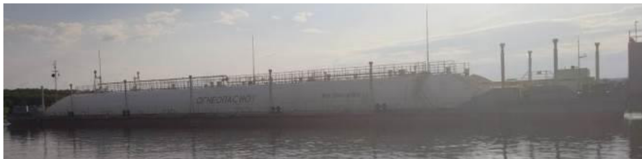
Р и с у н о к 1 – Общий вид нефтеналивной баржи «Пойма-3»

Общий вид нефтеналивной баржи «Пойма-3» представлен на рисунке 1. Схематичное расположение танков на палубе нефтеналивной баржи «Пойма-3» представлено на рисунке 2.