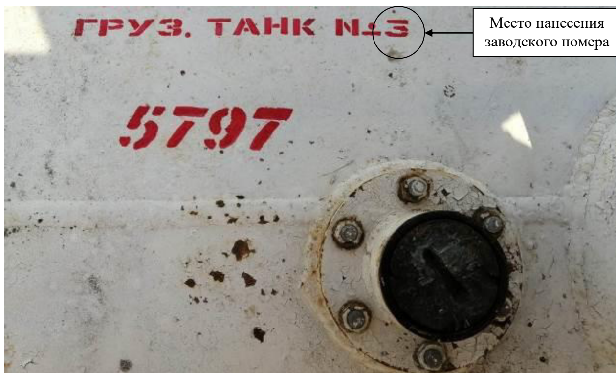
Р и с у н о к 3 – Общий вид замерного люка и места нанесения заводского номера

Заводские номера в виде цифровых обозначений, обеспечивающие идентификацию каждого экземпляра средств измерений, нанесены на стенки танков методом окраса. Общий вид замерного люка и место нанесения заводского номера представлены на рисунке 3.