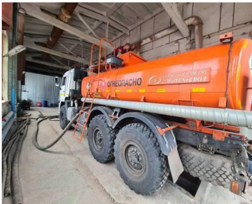
Рисунок 1 – Общий вид автоцистерны 6619Н-19