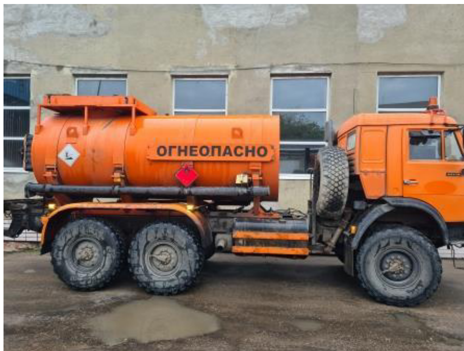
Рисунок 1 – Общий вид автоцистерн УНИКОМ