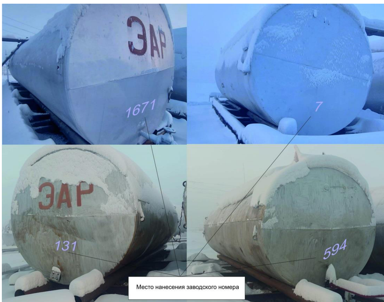
Рисунок 2 – Общий вид резервуаров горизонтальных стальных цилиндрических РГС-50 с указанием места нанесения заводских номеров