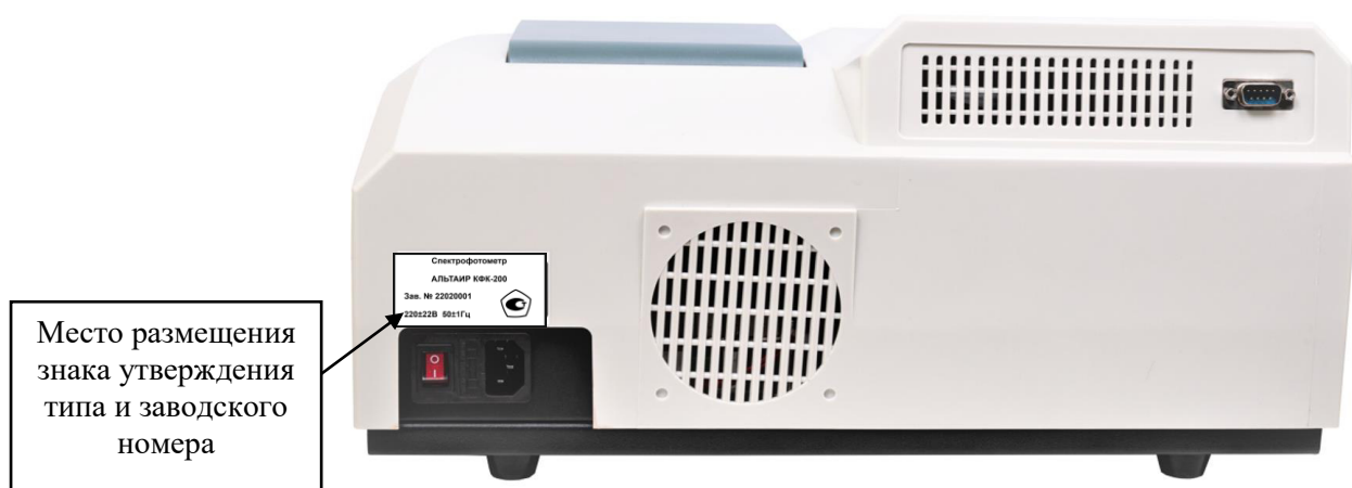
Рисунок 2 – Задняя стенка спектрофотометра Альтаир КФК-200