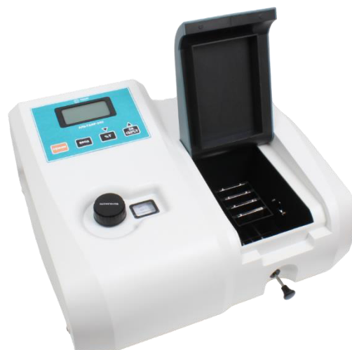
б) Альтаир КФК-200