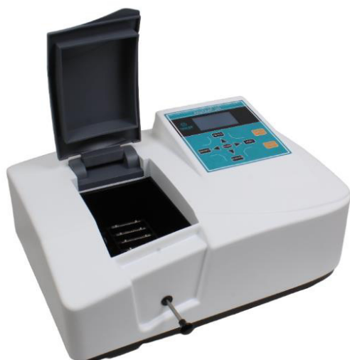
а) Альтаир КФК-300/КФК-300УФ