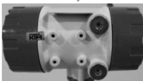
Рисунок 3 – Маркировочная табличка и её расположение на БОИ