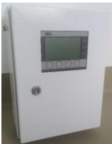
Рисунок 2 – Модуль выносной преобразователей плотности КТМ СКАЛЯРИС

Заводской номер, состоящий из 10 цифр, наносится на маркировочную табличку, закрепляемую на корпусе БОИ (способ нанесения – лазерная гравировка). Расположение маркировочной таблички на БОИ показано на рисунке 3.