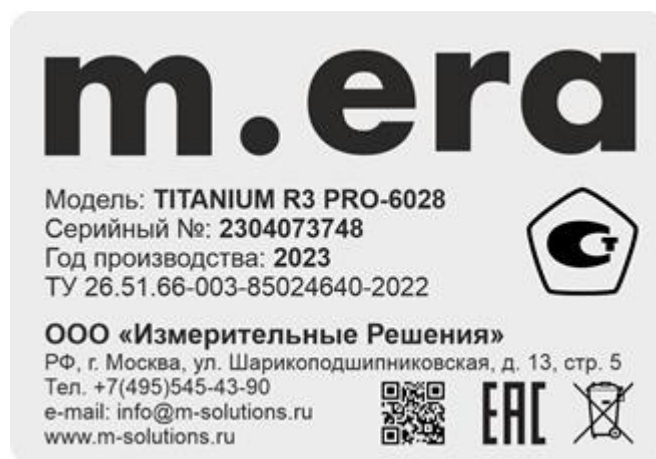
Рисунок 2 – Вид маркировочной таблички