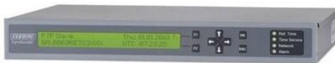
а) сервер времени