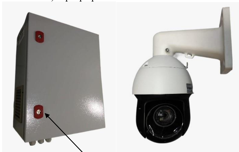
б) шкаф управления