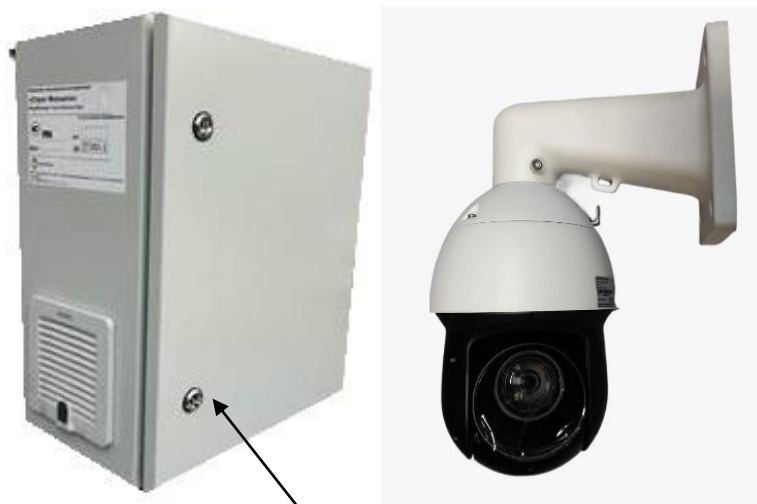
б) шкаф управления