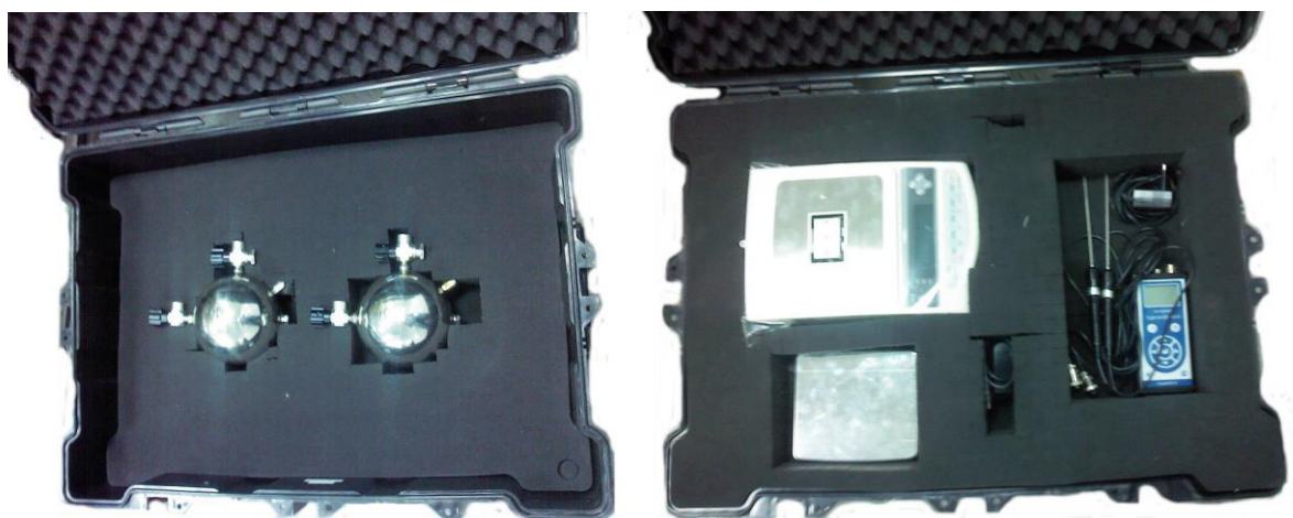
Рисунок 1 – Общий вид установки пикнометрической ПУ-ИнКС

Пломбирование установки не предусмотрено.