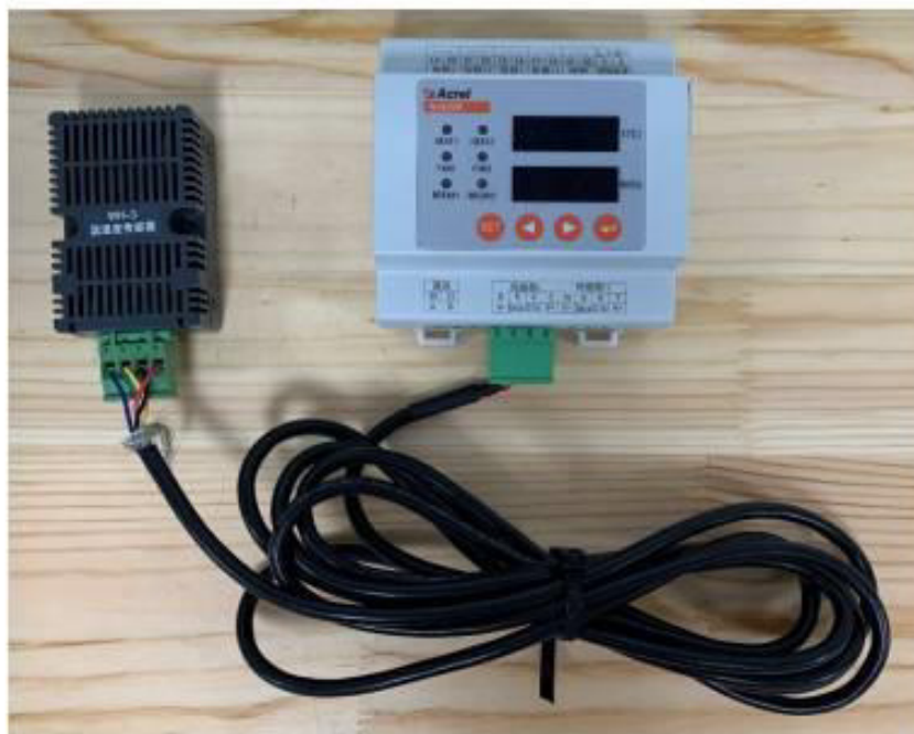
Рисунок 1 – Общий вид контроллера температуры и относительной влажности WHD20R-11

Заводской номер в виде обозначения, состоящего из арабских цифр, наносится на этикетку, прикрепленную на обратную сторону корпуса электронного блока контроллера, способом, принятым на предприятии-изготовителе. Место нанесения заводского номера приведено на рисунке 2.