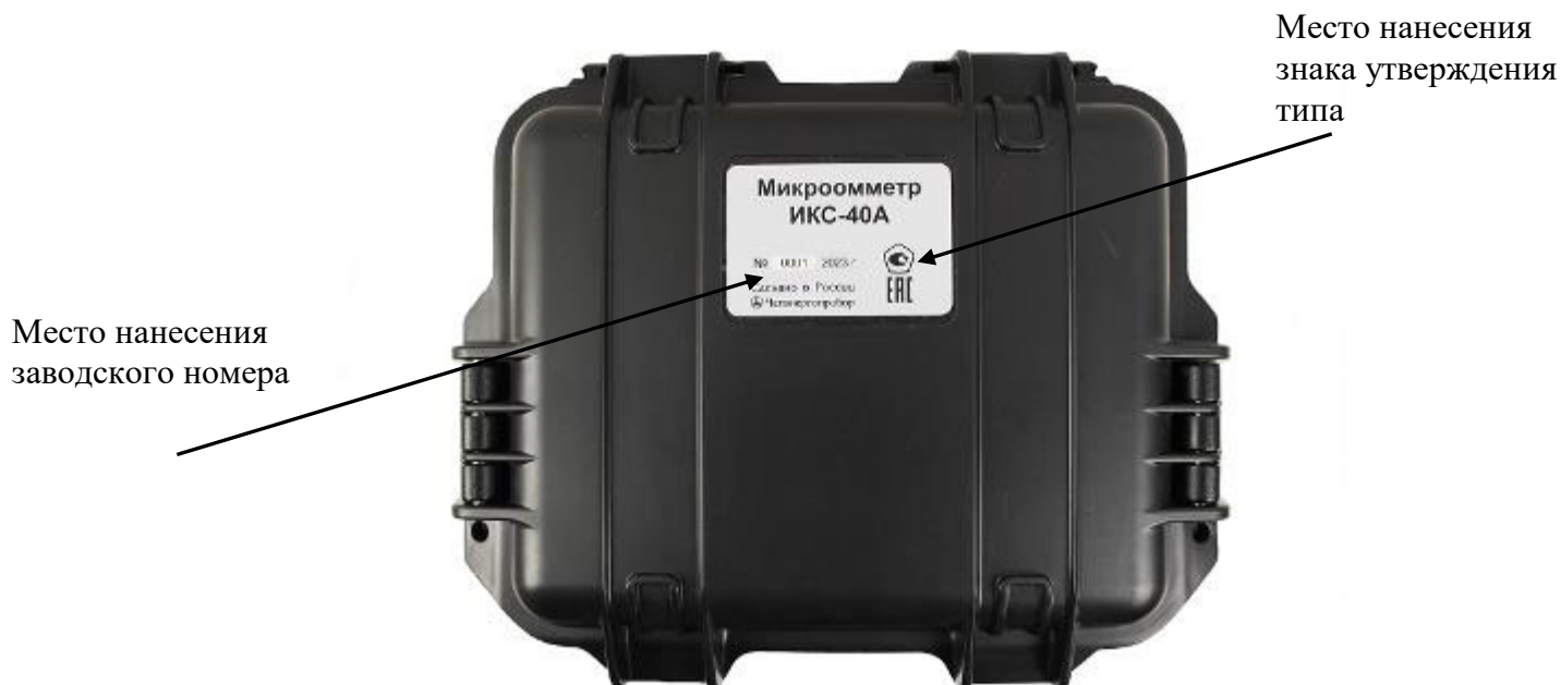
Рисунок 1 – Общий вид микроомметров исполнения ИКС-40А с местами нанесения знака утверждения типа и заводского номера (в закрытом виде)

Внешний вид микроомметров, места пломбирования, место нанесения знака утверждения типа и заводского номера приведены на рисунках 1 - 4.