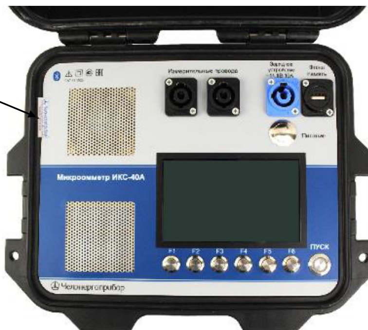
Рисунок 2 – Общий вид микрометров исполнения ИКС-40А с местом нанесения пломбировочной наклейки (в открытом виде)