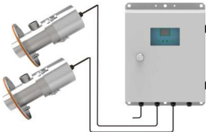
Рисунок 1 – Общий вид измерителей модели ETL-F Ultra