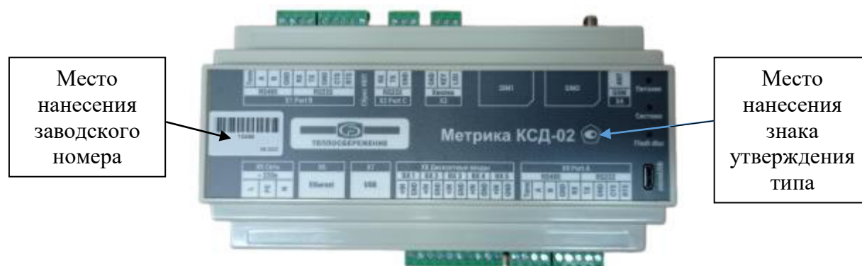
Рисунок 3 – Места нанесения на корпус УСПД заводского номера и знака утверждения типа средств измерений

Заводской номер УСПД состоит из арабских цифр, является уникальным, присваивается предприятием-изготовителем при выпуске из производства нарастающим итогом и указывается на корпусе УСПД в соответствии с рисунком 3 и в паспорте УСПД.