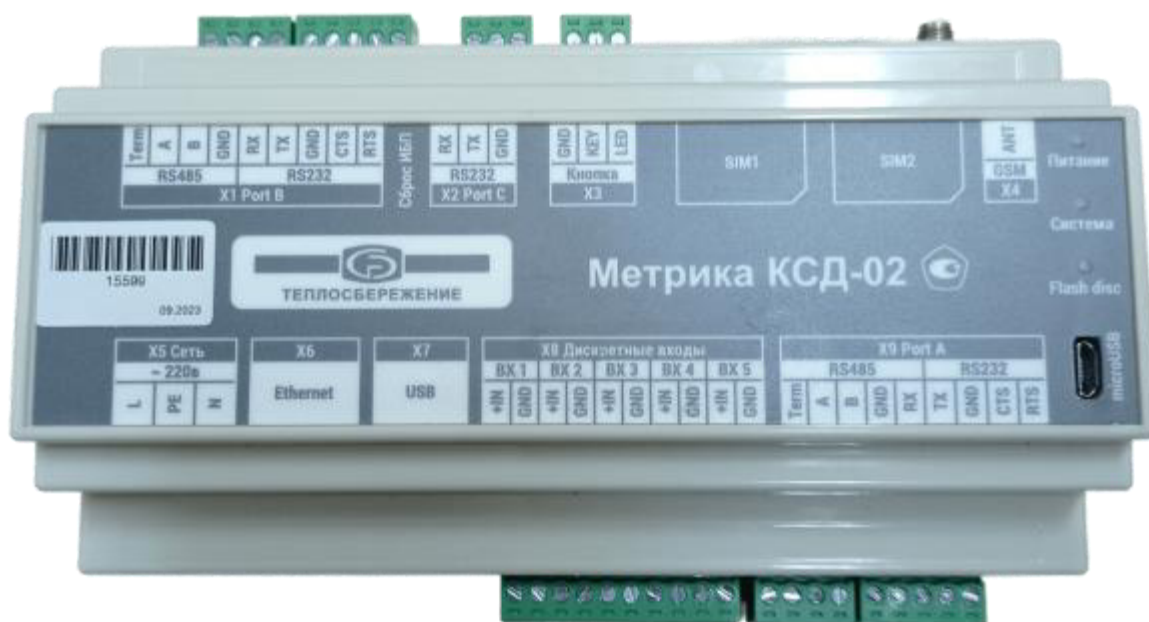
Рисунок 1 — Общий вид УСПД