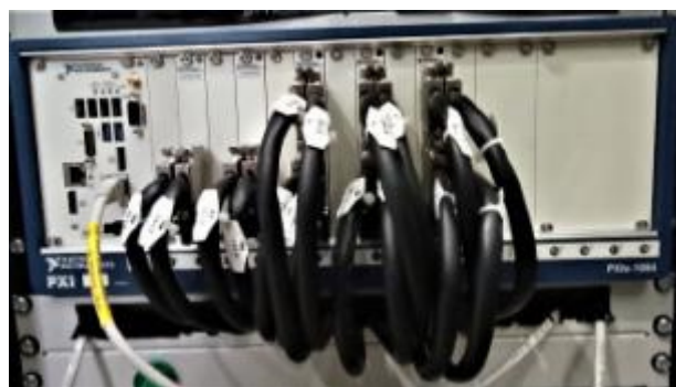
Рисунок 2 – Шасси NI PXIe-1084 с модулями измерительными