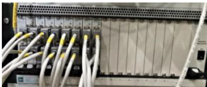
Рисунок 3 – Модули ME-320F в крейте MIC-236