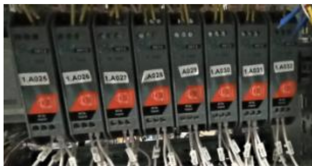
Рисунок 6 – Блоки гальванической развязки и преобразования сопротивления в напряжение ICP DAS SG-3013