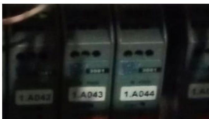
Рисунок 7 – Блоки гальванической развязки и преобразования тока в напряжение ICP DAS SG-3081