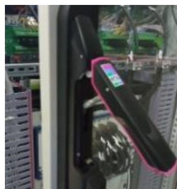
Рисунок 4 – Стойка СИ1. Запирающий механизм