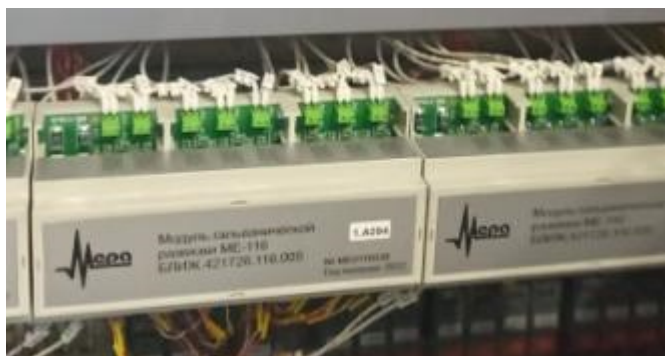
Рисунок 5 – Модуль гальванической развязки ME-116 в стойке СИ1