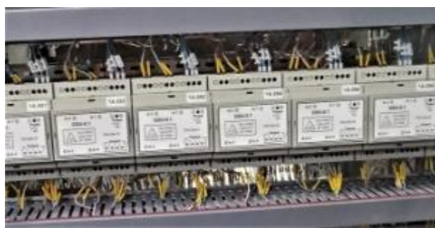
Рисунок 8 – Блоки гальванической развязки GSU-0.1