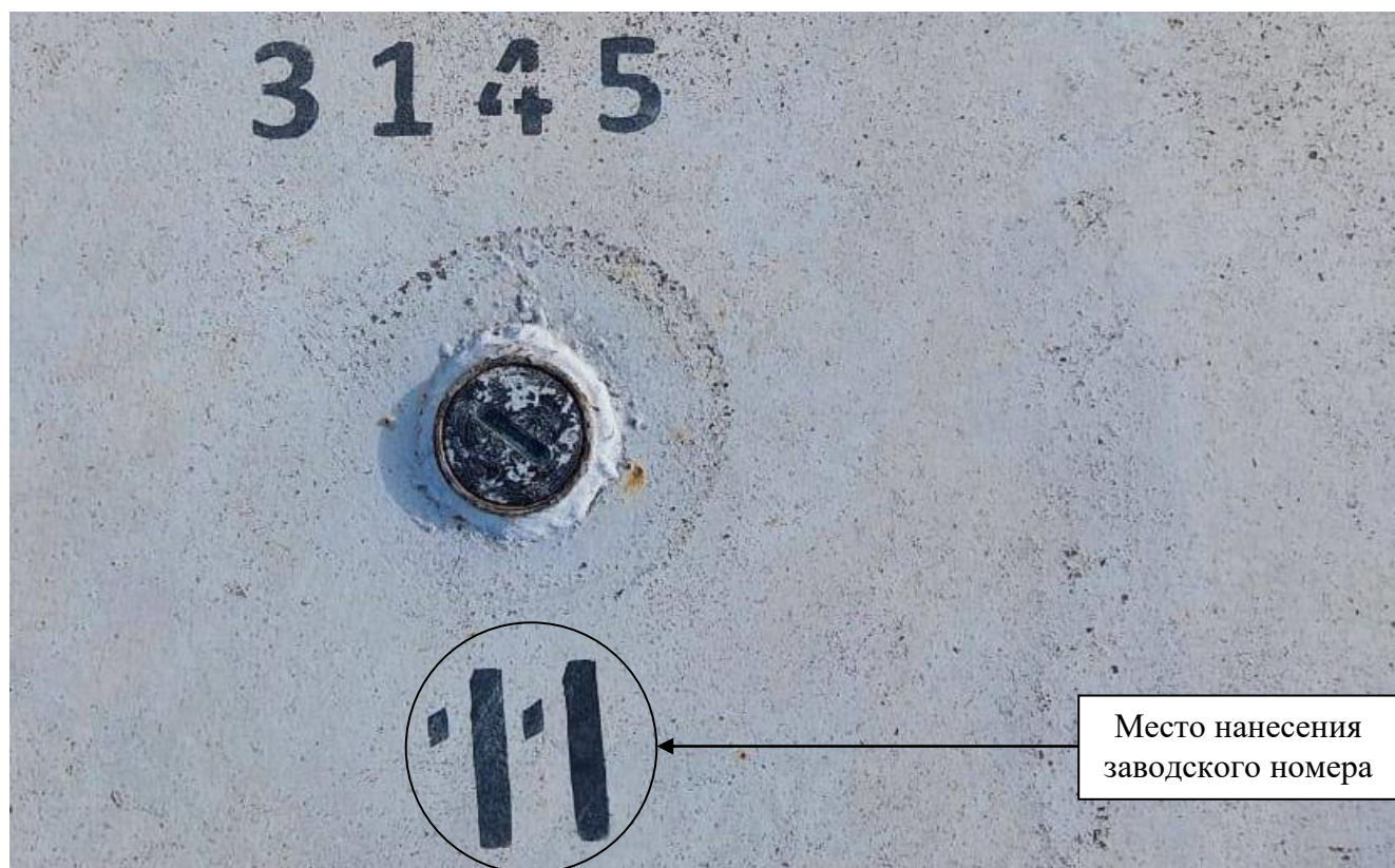
Р и с у н о к 3 – Общий вид замерного люка и места нанесения заводского номера

Заводские номера в виде цифровых обозначений, обеспечивающие идентификацию каждого экземпляра средств измерений, нанесены на стенки танков методом окраса. Общий вид замерного люка и место нанесения заводского номера представлены на рисунке 3.