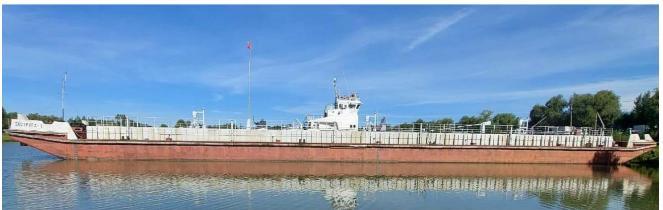
Р и с у н о к 1 – Общий вид нефтеналивной баржи «Заструга-1»

Общий вид нефтеналивной баржи «Заструга-1» представлен на рисунке 1.