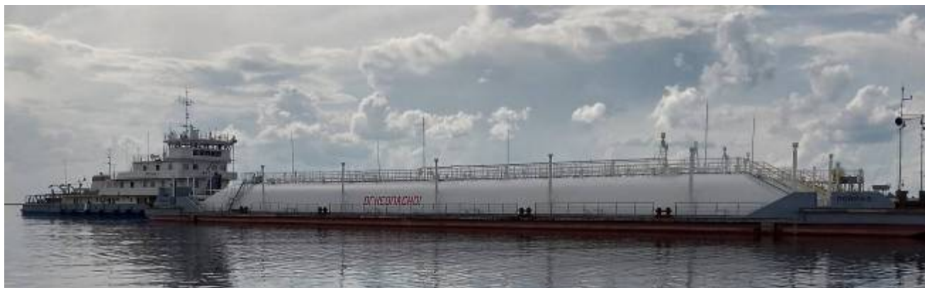
Р и с у н о к 1 – Общий вид нефтеналивной баржи «Пойма-2»

Общий вид нефтеналивной баржи «Пойма-2» представлен на рисунке 1. Схематичное расположение танков на палубе нефтеналивной баржи «Пойма-2» представлено на рисунке 2.