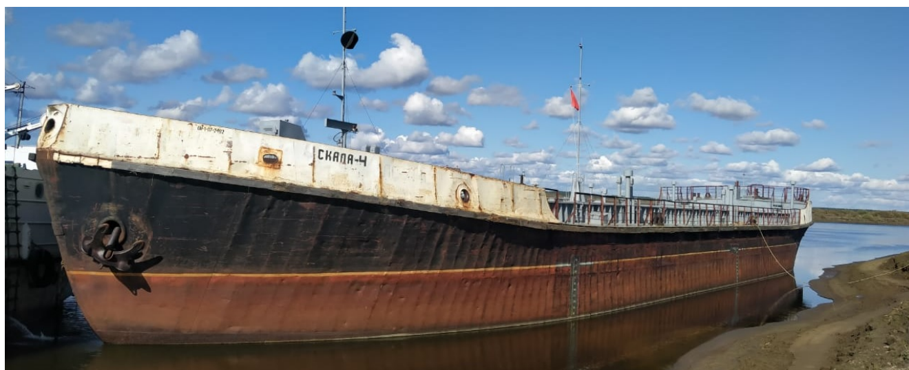
Р и с у н о к 1 – Общий вид нефтеналивной баржи «Скала-4»

Общий вид нефтеналивной баржи «Скала-4» представлен на рисунке 1.