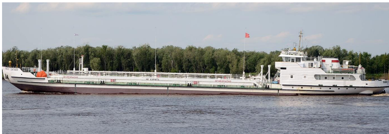
Р и с у н о к 1 – Общий вид танкера «Рифгат Султанов»

Общий вид танкера «Рифгат Султанов» представлен на рисунке 1.