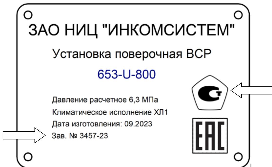
Рисунок 3 – Обозначения мест нанесения знака утверждения типа и заводского номера

Обозначения мест нанесения знака утверждения типа и заводского номера представлены на рисунке 3.