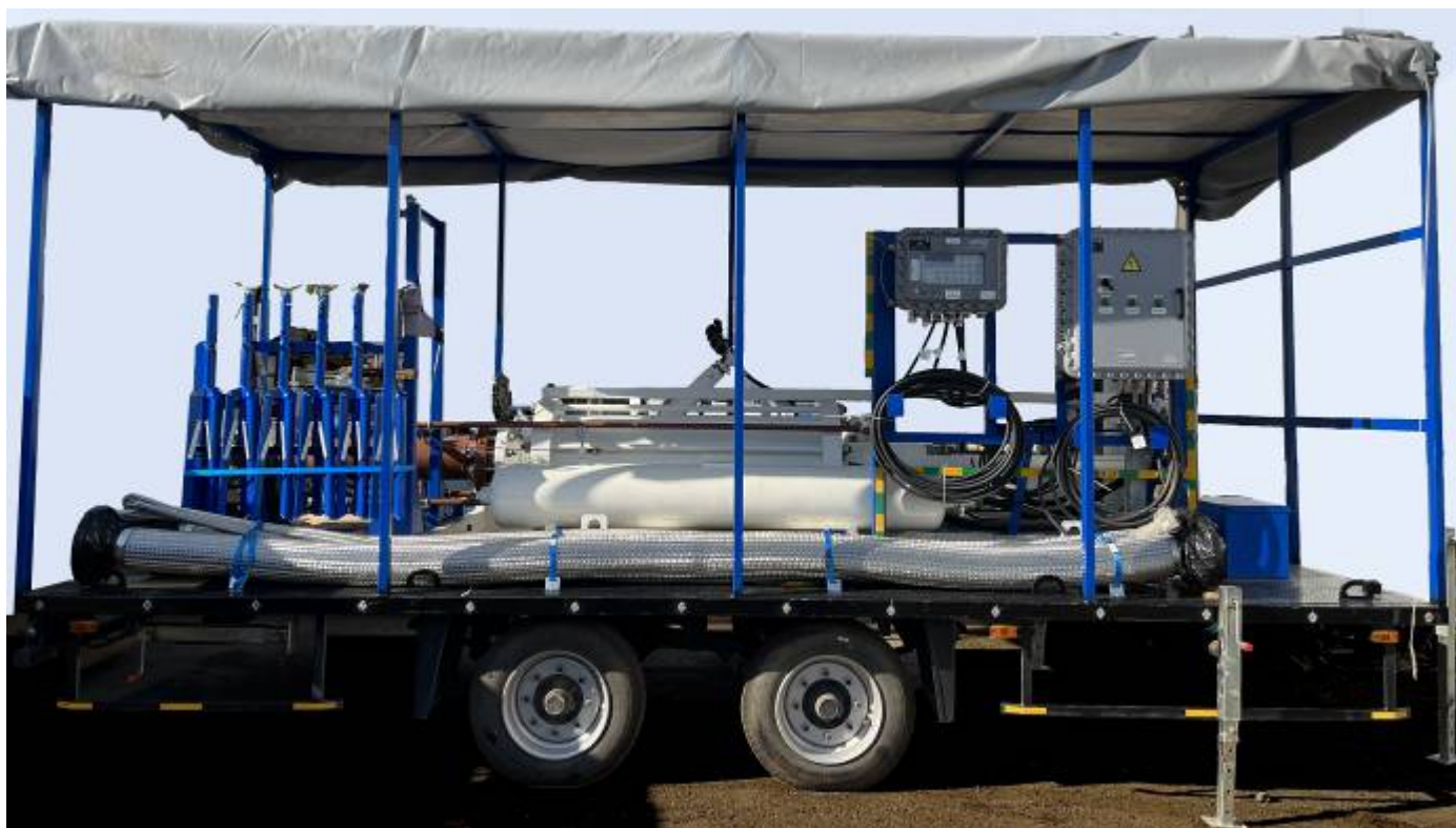
Рисунок 1 – Общий вид установки

Общий вид установки представлен на рисунке 1.