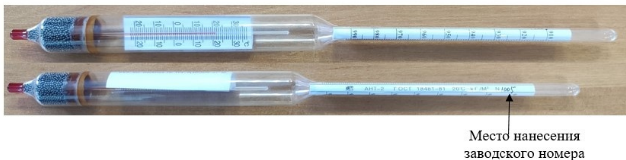
Рисунок 2 - Общий вид ареометров стеклянных для нефти модификации АНТ-2

Пломбирование ареометров не предусмотрено.