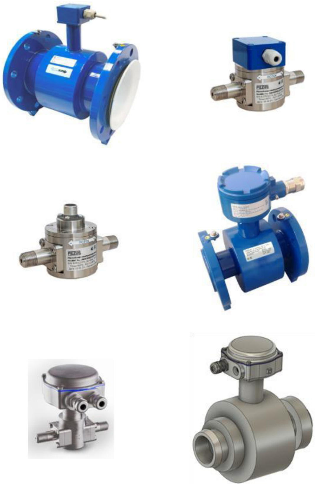
Рисунок 3 – Общий вид сенсоров раздельного исполнения

Схема пломбировки расходомера от несанкционированного доступа, представлена на рисунке 4.