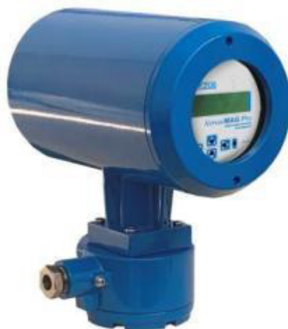
Рисунок 2 – Общий вид электронных блоков расходомеров раздельного исполнения