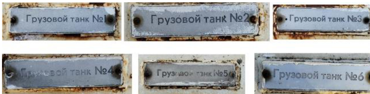
Рисунок 1 – Заводские номера, нанесенные на металлические таблички