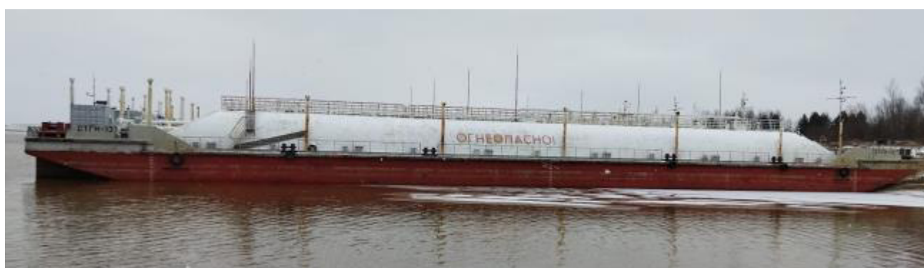
Рисунок 3 – Общий вид танков несамоходного наливного судна (баржи) «СТГН-12» Пломбирование танков не предусмотрено.