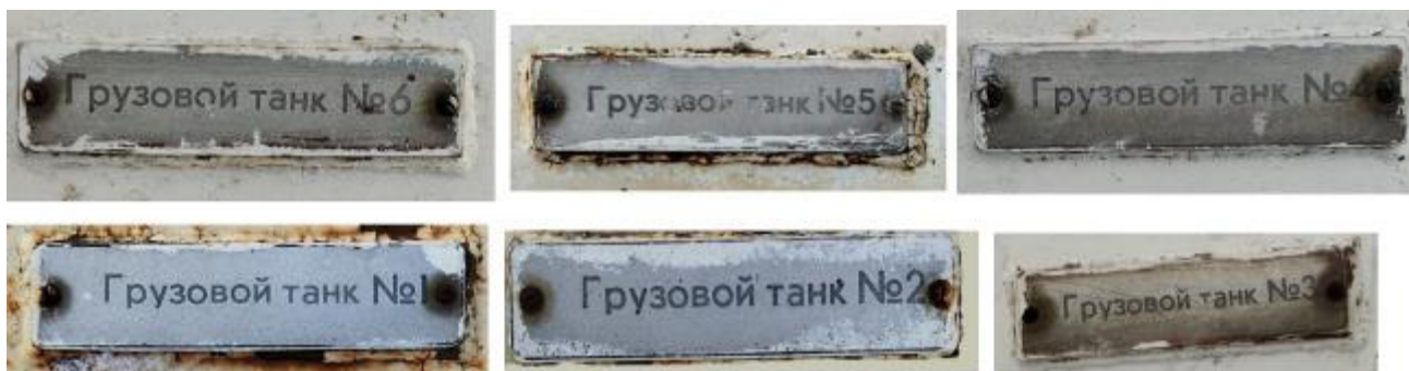
Рисунок 1 – Заводские номера, нанесенные на металлические таблички