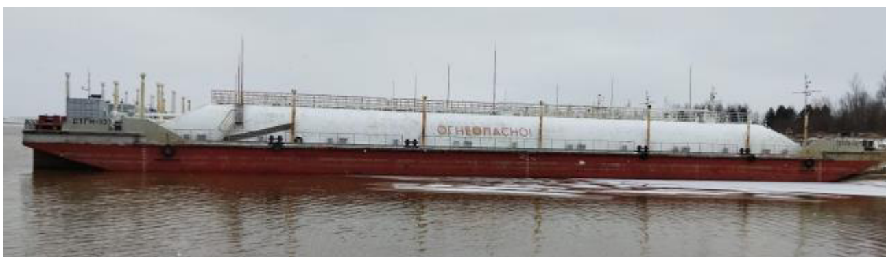
Рисунок 3 – Общий вид танков несамоходного наливного судна (баржи) «СТГН-14» Пломбирование танков не предусмотрено.