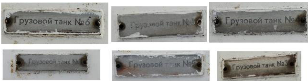
Рисунок 1 – Заводские номера, нанесенные на металлические таблички