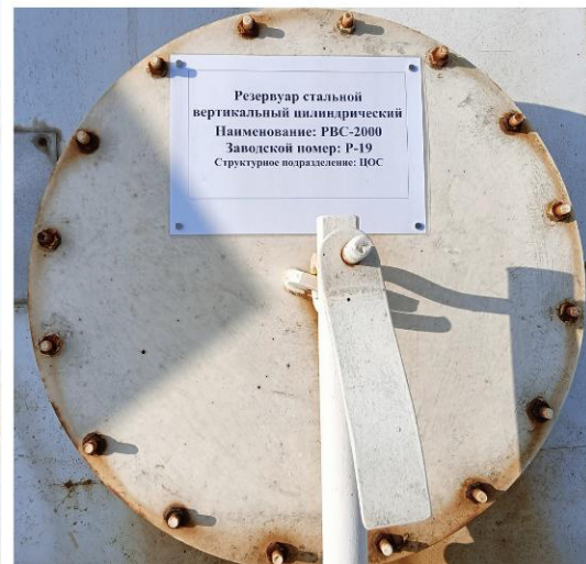
Рисунок 1 – Общий вид резервуара РВС-2000 № Р-19