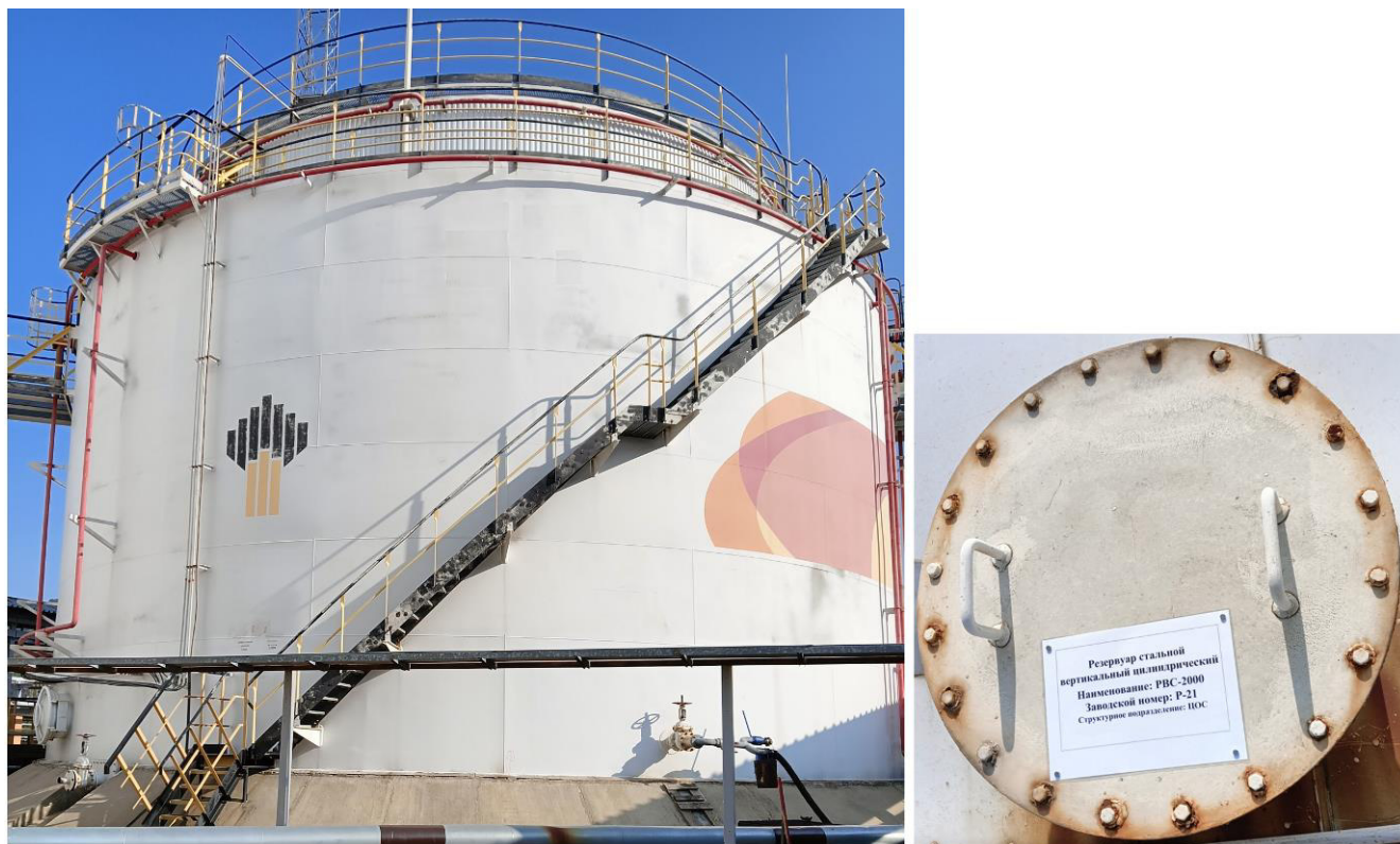
Рисунок 3 – Общий вид резервуара PBC-2000 № P-21 Пломбирование резервуаров PBC-2000 не предусмотрено.