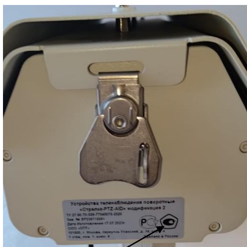
Место нанесения знака утверждения типа

Место нанесения знака утверждения типа устройств представлены на рисунке 2.