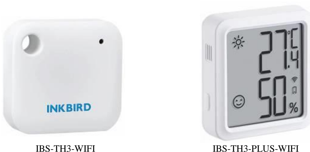
Рисунок 1 – Общий вид термогигрометров

На рисунке 1 представлены фотографии общего вида термогигрометров.