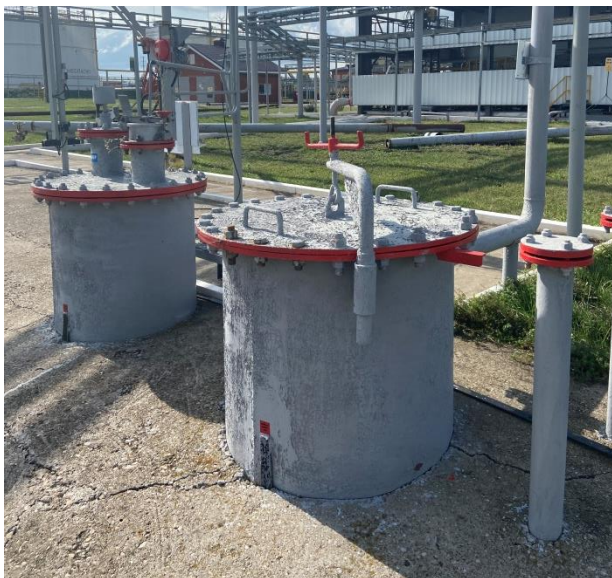
Рисунок 2 – Горловины и замерный люк резервуара.

Пломбирование резервуара не предусмотрено.