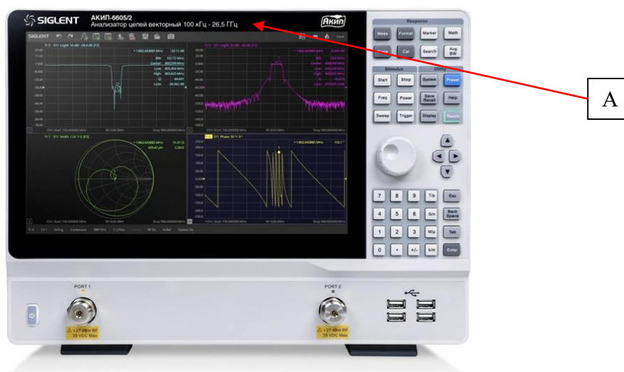
Рисунок 1 – Общий вид анализаторов и место нанесения знака утверждения типа (А)

Общий вид анализаторов и место нанесения знака утверждения типа представлены на рисунке 1.