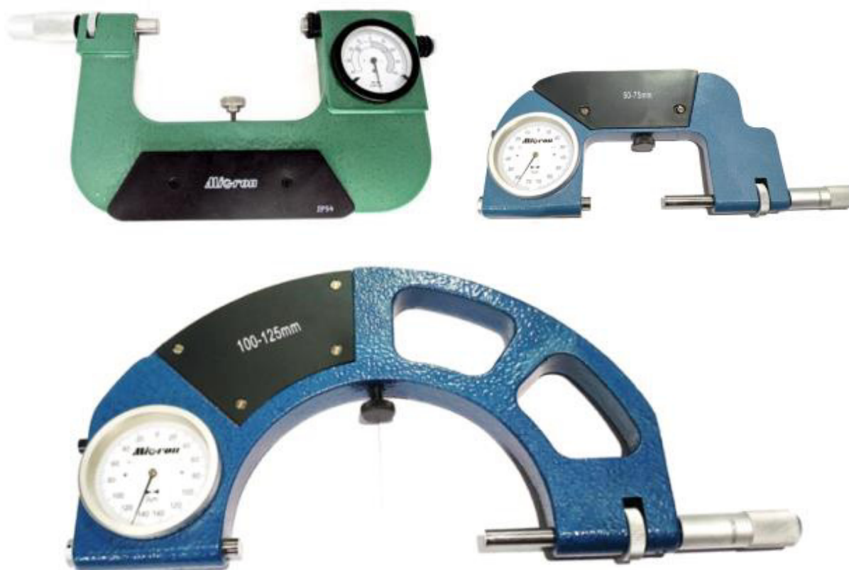
Рисунок 2 - Общий вид скоб модели СР