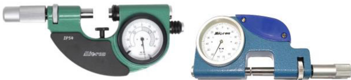
Рисунок 1 - Общий вид скоб моделей СР и СРП

Фотографии общего вида скоб представлены на рисунках 1 - 3. Обозначение места нанесения заводского номера представлены на рисунке 4.