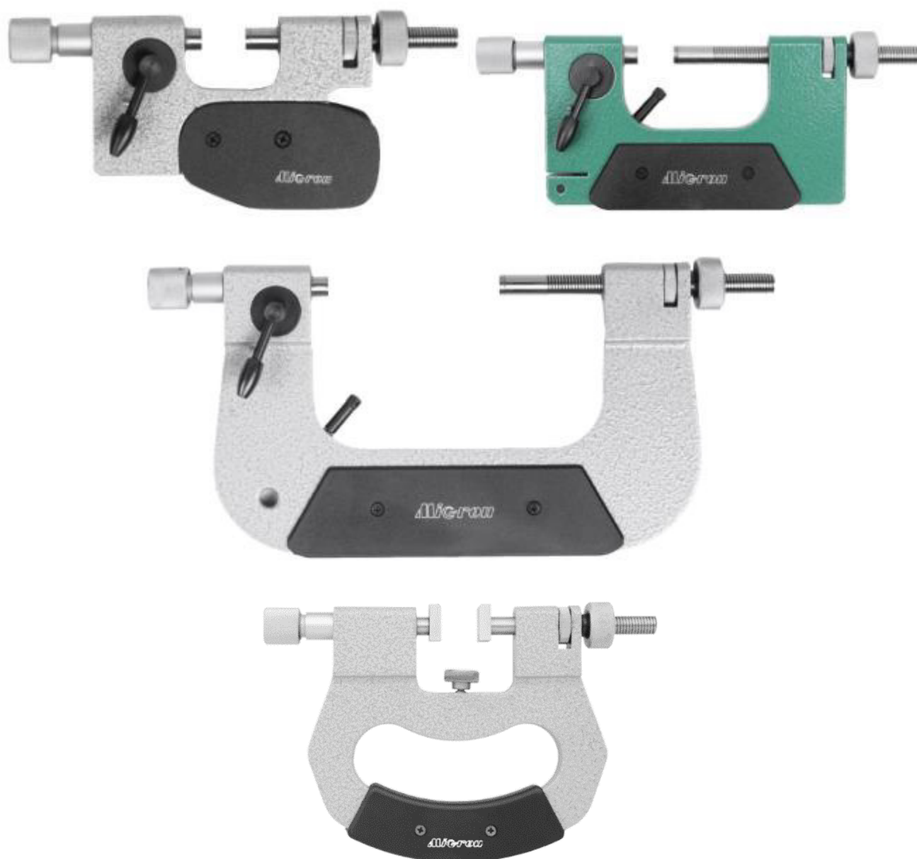
Рисунок 3 - Общий вид скоб моделей СИ и СЦ (без отсчетного устройства)