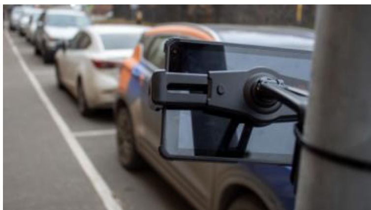
Рисунок 4 – Стационарный вариант размещения комплексов (исполнение 2)

Пломбирование комплексов не предусмотрено. Знак поверки на комплексы не наносится.