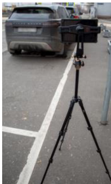
Рисунок 3 – Передвижной вариант размещения комплексов (исполнение 2)