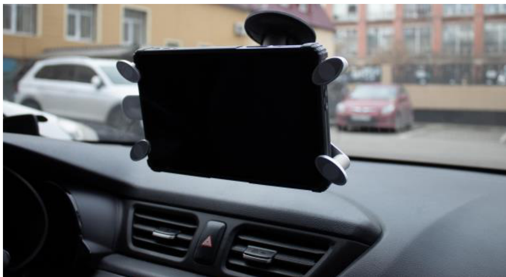
Рисунок 1 – Мобильный вариант размещения комплексов (исполнение 1)

Общий вид комплексов в различных вариантах размещения приведен на рисунках 1 - 4. Пример маркировки комплексов с указанием места нанесения знака утверждения типа представлен на рисунке 5.