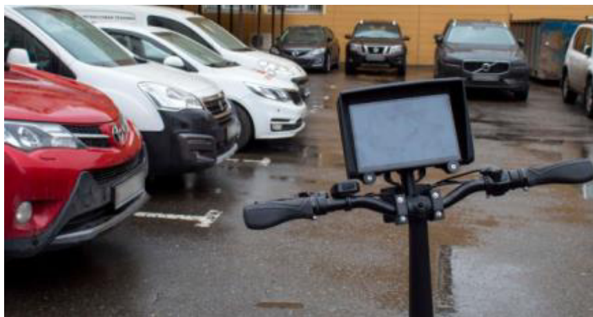
Рисунок 2 – Мобильный вариант размещения комплексов (исполнение 1)